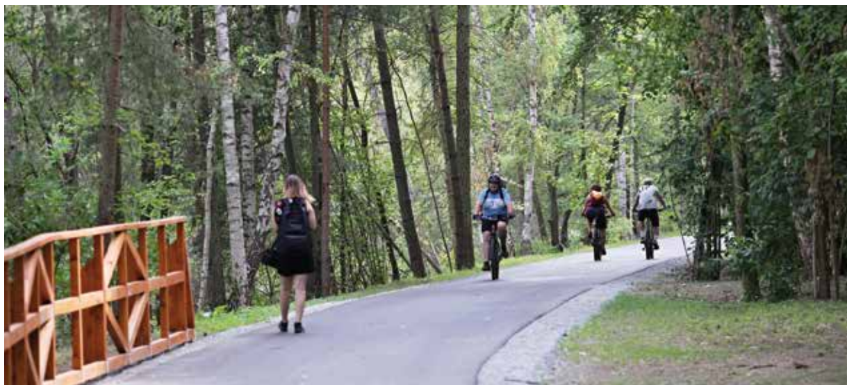
Od léta slouží lidem nová stezka u Vejprnického potoka. Lidé se díky ní dostanou z Plzně až do Nýřan.