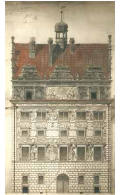
Koulová návrh na výzdobu průčelí radnice.

Podle pověsti štít plzeňské radnice od její přestavby stavitelem Giovanniem de Statia v letech 1554–1559 zdobily sluneční hodiny. Byly prý ale zrušeny, protože někdejší magistrát usoudil, že „jsou málo platné, jelikož prý ukazují jen za časných ranních hodin, kdy páni měšťané ještě spí nebo už na svých polnostech nebo v jiném hospodářství mimo město meškají, nebo zase za odpoledních hodin, kdy už se den sklání k večeru. V nehlavnější hodiny denní ... překáží kostel slunci, aby na hodiny svítilo tak, aby čas mohly správně ukazovat. Proto rozhodli páni konšelé, že na radnici má být dán orloj pořádným mistrem za obecní groš zhotovený.“