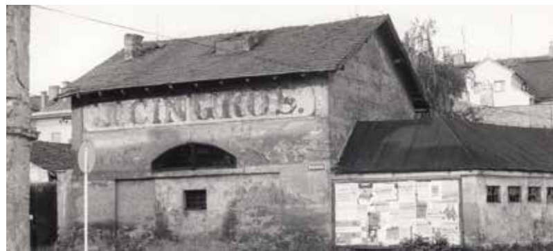
Pohled na jednu z původních budov Cingrošovy továrny. V současné době však již nápis CINGROŠ není patrný.