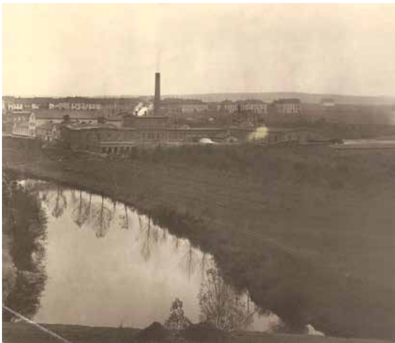
Takto vypadala Piettova papírna na fotografii Ladislava Lábků z počátku 20. století.

Stromy oplotíme, aby se ochránil jejich kořenový prostor. Nebudou tam projíždět žádná auta ani se tam nebude skladovat těžký materiál nebo kopat. Budeme usilovat o maximální ochranu starých hodnotných stromů. Jsou to většinou duby. Papírenský park vznikl v druhé polovině 19. století a některé stromy se zachovaly od jeho počátků.