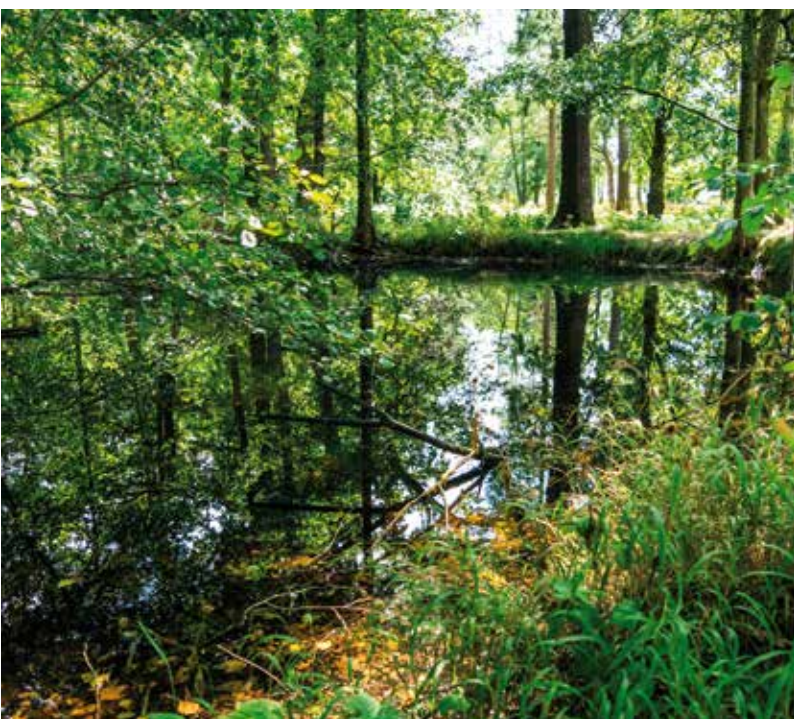
Pohled na jezírko, které je pozůstatkem původního parku patřícího kvile rodiny Piettů, někdejších vlastníků papírny.