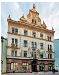
Právověrečný dům v Bezučově ulici 185/31 (na snímku), který byl vystavěn v roce

1903 stavitelem J. V. Paškem na místě původní klasicistní budovy. Fasáda podle návrhu architekta Štecha byla v přízemí obložena leštěnou žulou z produkce Cingrošovy továrny.