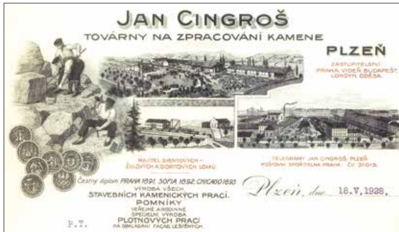
Výřez z hlavičkového papíru firmy Jan Cingroš.

Specializoval se zejména na práce pomníkové. Podílel se na výrobě pomníku