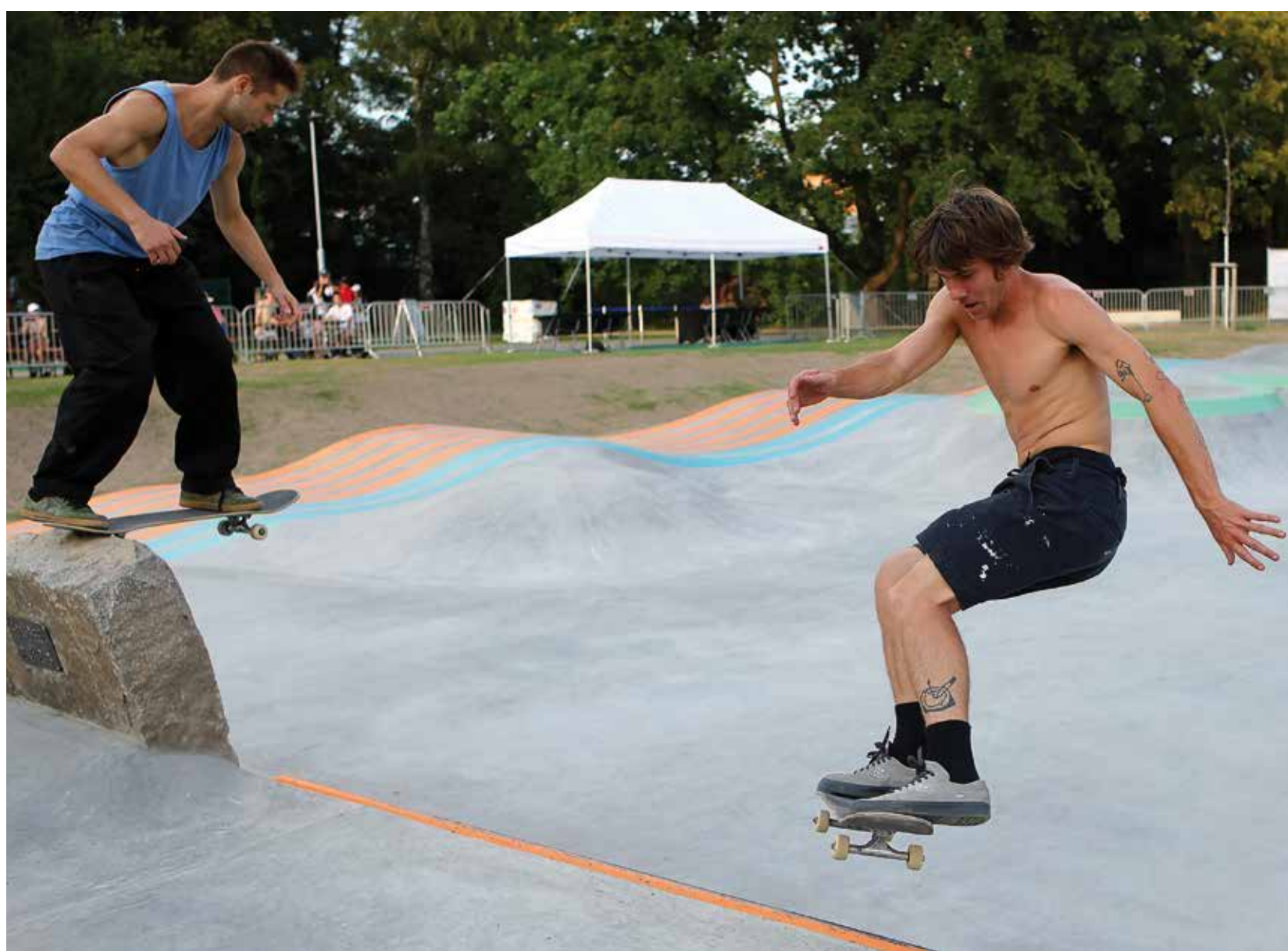
Na Sportmanii Plzeň si mali i velcí skateboardisté mohli poprvé vyzkoušet nové unikátní skateboardové hřiště za OC Plzeň Plaza. Nyní je bez omezení přístupné široké veřejnosti.

Velký zájem na Sportmanii vzbudilo nové skateboardové hřiště, které bylo za OC Plzeň Plaza slavnostně otevřeno tři dny před jejím zahájením. Nyní je bez omezení přístupné široké veřejnosti. Jeho výstavbu financovalo město Plzeň a obvod Plzeň 1. Na realizaci spolupracovali profesionální jezdci a další lidé ze skateboardové komunity. V areálu za téměř 13,5 milionů korun čeká na skateboardisty hned několik prvků, které jsou ve skateparcích v České republice unikátní, podobné jsou zejména v USA a Skandinávii. Ve skateparku se mají jezdci možnost projet na klasických překážkách, jakými jsou bedny, bangy a radiusy. Nacházejí se zde i sešikmené a zaoblené betonové plochy, kulaté a hranaté kovové raily, tedy nízká kovová zábradlí pro jízdu na skateboardu. Unikátní je tzv. žulový fragment v radiusu, který v žádném jiném skateparku v České republice není.