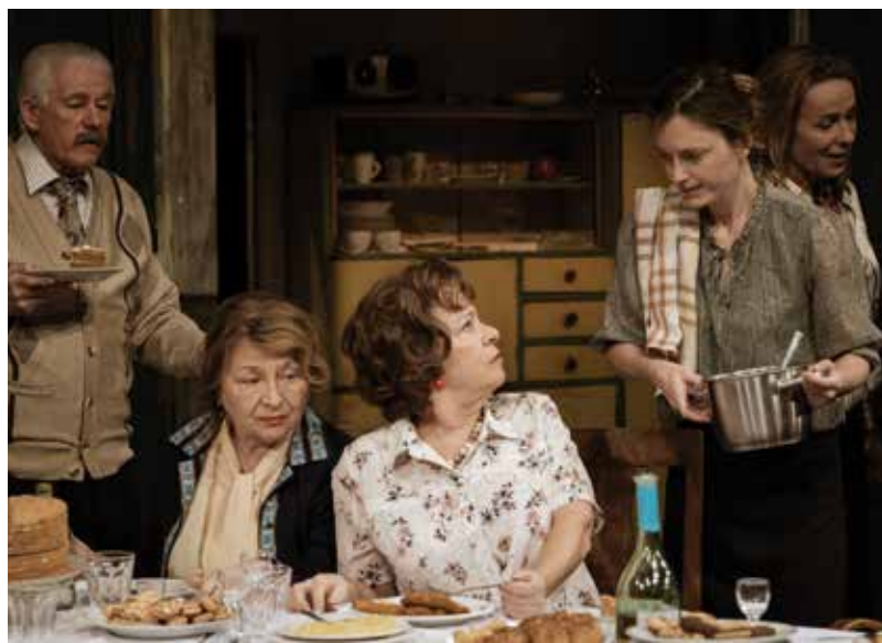
Na festivalu DIVADLO bude v sobotu 16. září ve Velkém divadle uvedena inscenace Děti v podání členů Slovenského národního divadla Bratislava.