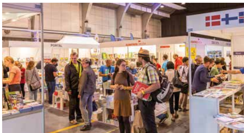
Svět knihy se v září koná v areálu DEPO2015.

Celý dvou denní program obsahuje více než 50 pořadů – diskuzí, křtů nových knih, scénických čtení, debat, výstav, autogramiád určených pro dospělé, děti a mládež. Zachován je rovněž loňský koncept dětem, jehož hlavním záměrem je formou zábavných i poučných pořadů a aktivit oslovit školní mládež různého věku, učitele a rodiče. Projekt bude opět propojen s kampaní Rosteme s knihou, již společnost Svět knihy organizuje od roku 2005. „Představení kvalitní literatury pro děti a mládež, včetně žánru young adult, je příležitostí pro odbornou i širokou veřejnost, jak získat přehled o aktuální tvorbě s možností zakoupení knih na místě. Podpora četby knih u dětí