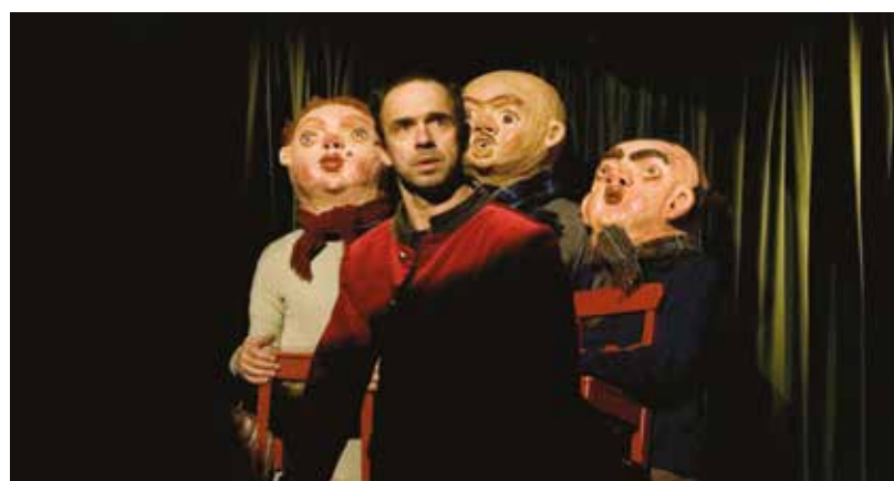
Obludárium Divadla bratří Formanů zavítá do Plzně na dva zářijové týdny.

Na konci srpna na zahradě Měšťanské besedy vyrostl speciální stan, v němž se předvádějí obludy. Po letech se do Plzně vrátilo legendární představení Divadla bratří Formanů Obludárium . Premiéru mělo v roce 2007 a od té doby má na svém kontě více než tisíc repríz po celé Evropě i ve světě a také prestižní divadelní Cenu Alfréda Radoka . „Představení je volným sledem rozmanitých čísel a drobných příběhů, které díky netradičnímu prostředí