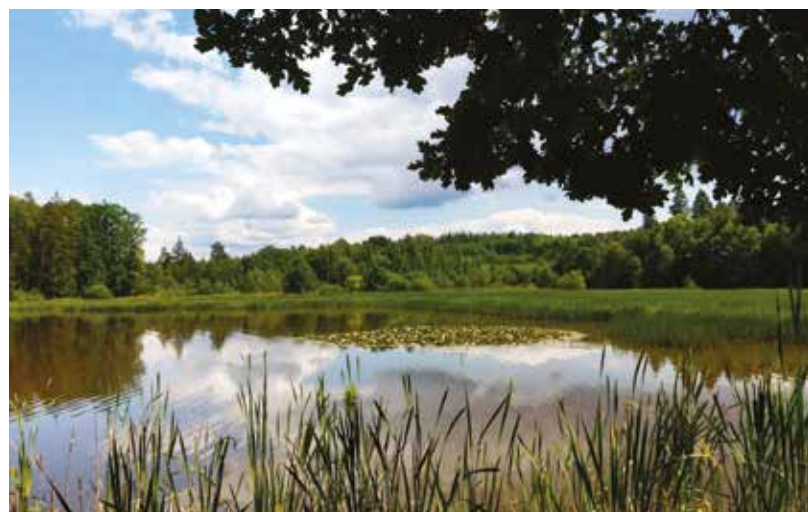
Celou oblastí Kokoty vede naučná stezka. SVSMP plánuje obnovit Podhorní kokotský rybník na Rokycansku.