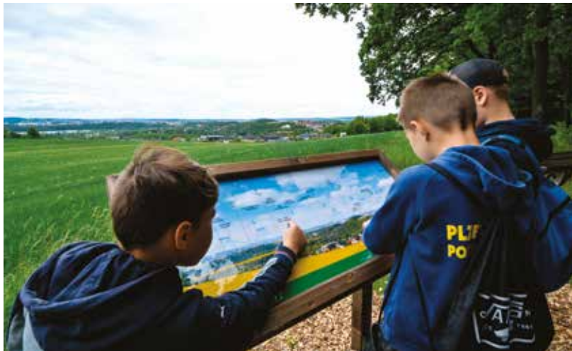
Naučná stezka v rekreační oblasti Dubová hora byla otevřena na začátku léta.