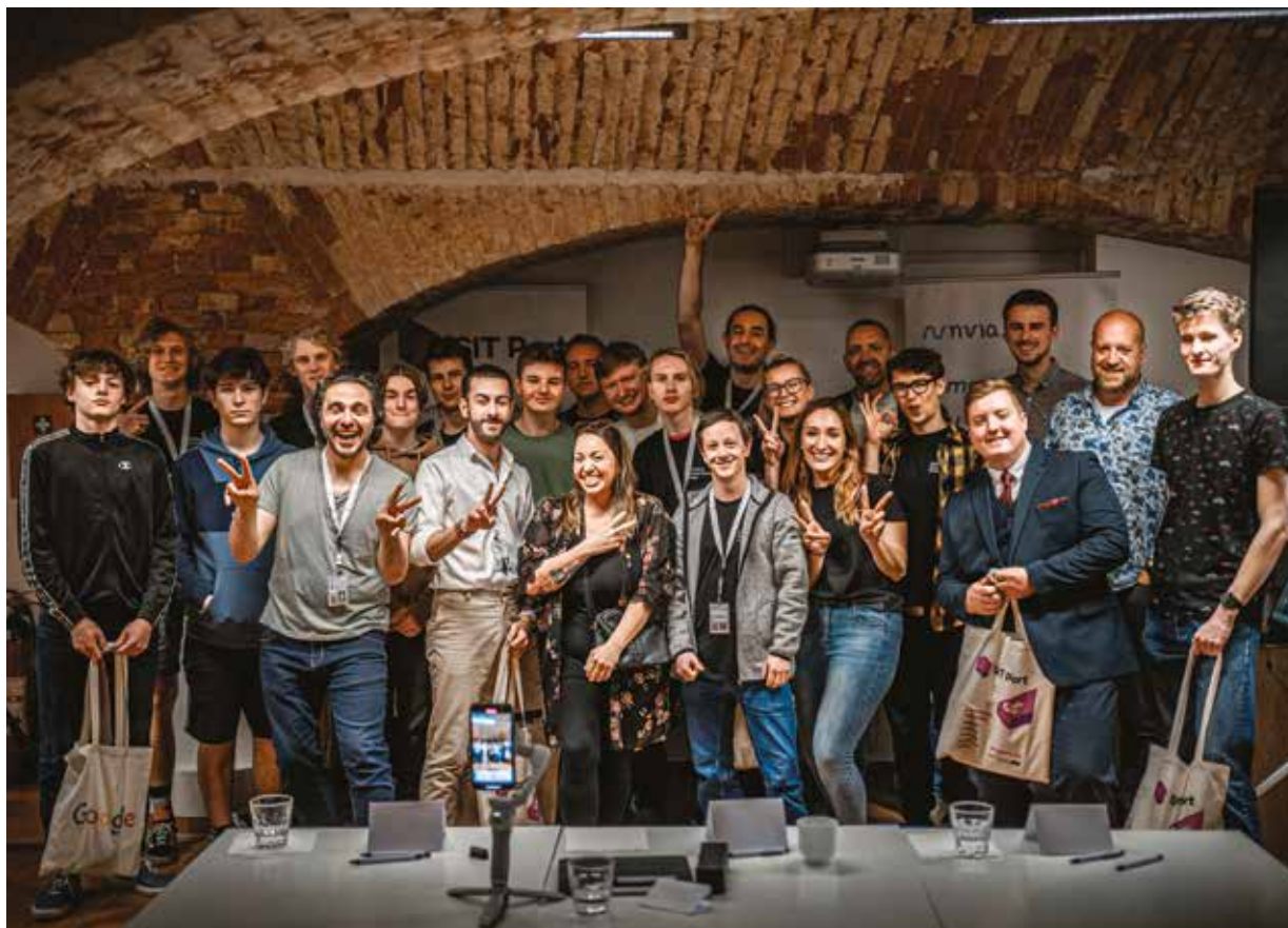
SIT města Plzně ve svém programu PINE buduje vztah dětí k technice. Organizuje pro ně zajímavé kroužky i akce a neopouští je ani v pozdějším věku, mladým lidem pomáhá s jejich startupy.

Ekosystém PINE je rozdělen do čtyř etap. Začíná rozvojem talentů, kdy se děti setkávají zábavnou formou s technikou, pokračuje přes preinkubaci, tedy fázi, v níž se mladí lidé profilují v jednotlivých oborech, začínají mít myšlenky na vlastní podnikání a zakládají startupy. Poté plyne navazující inkubaci samotné, kde dochází k růstu nadějných společností, aby v poslední etapě, akcelerační, bylo možné pracovat na rozvoji firmy v konkurenceschopný a stabilní podnik. „V ekosystému PINE je zapojena celá řada partnerů, a to nejen z řad městských organizací. Naším cílem je vytvořit v Plzni prostředí plné příležitostí, které bude motivovat talentované lidi, aby neodcházel do