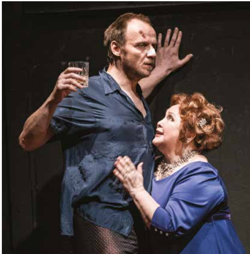
Nada Konvalinková a Jan Hájek v inscenaci Kočka na rozpálené plechové střeše .