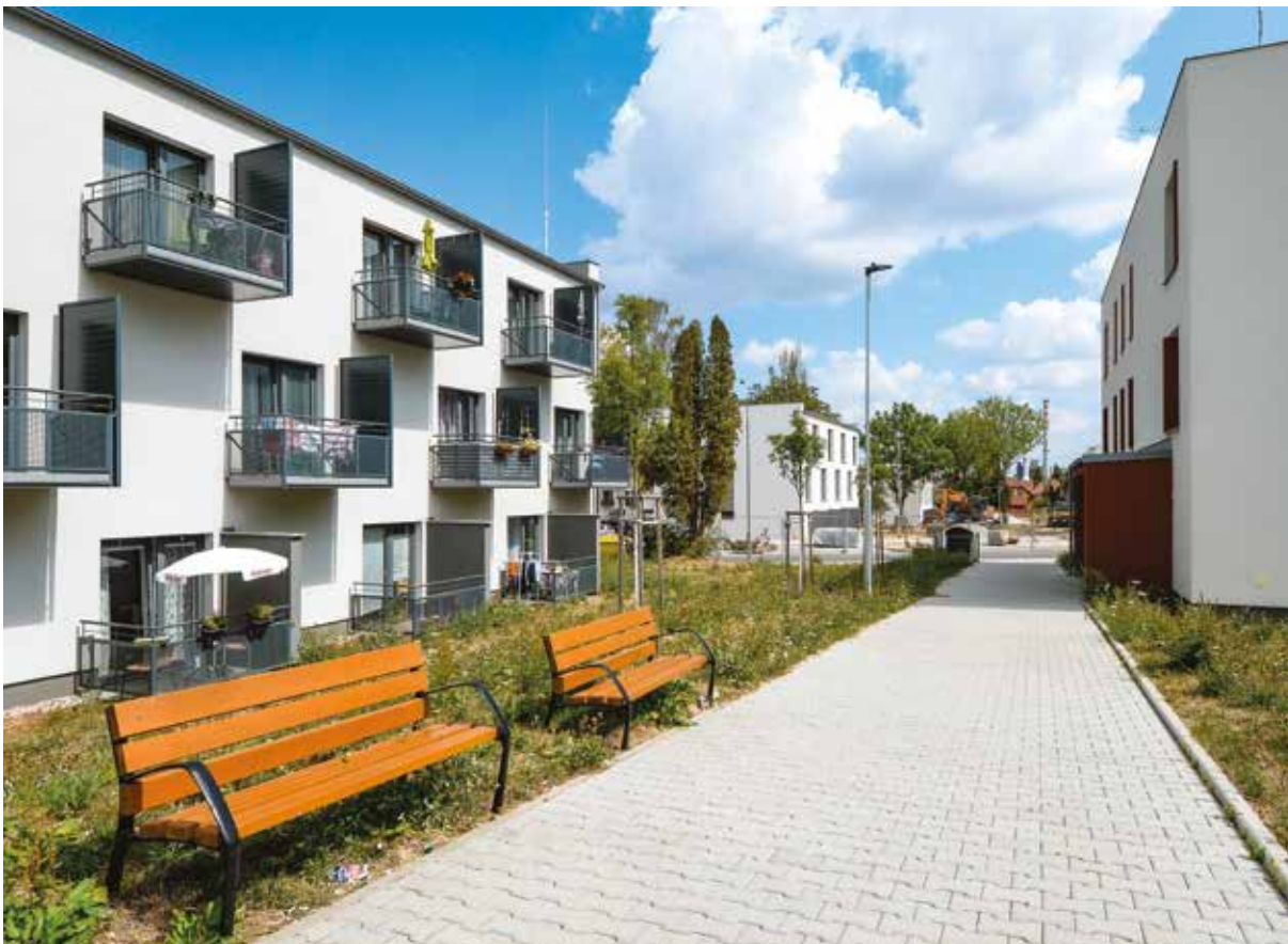
Nová čtvrť v Zátíší bude slavnostně otevřena 9. září.