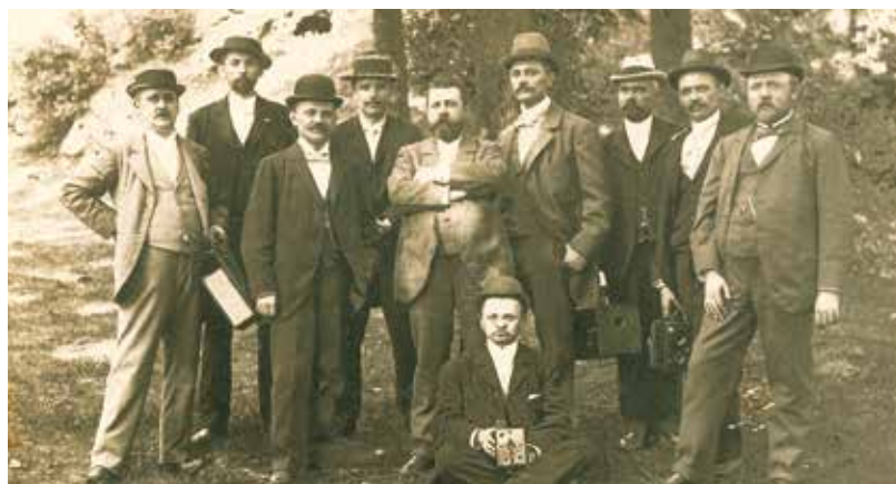
Výlet klubu fotografů amatérů na Vlčejn 30. května 1897.