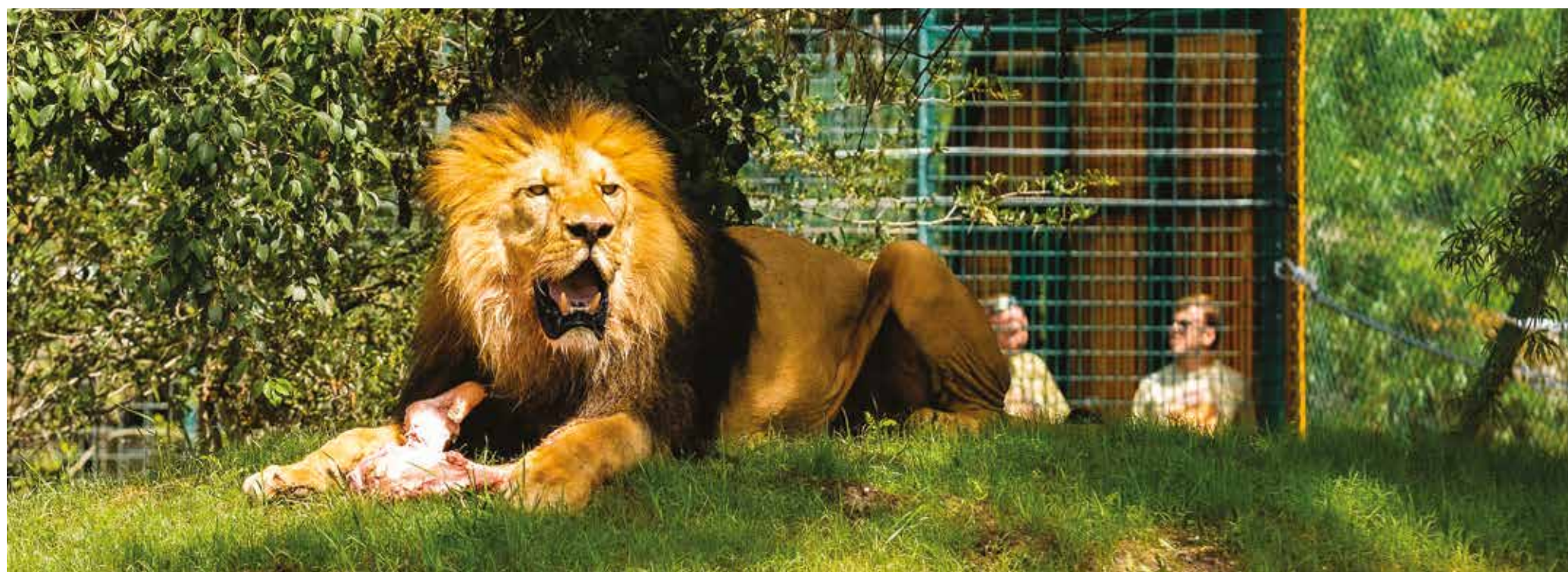
Nový lví výběh v Zoologické a botanické zahradě města Plzně poskytuje větší komfort lví smečce i lepší výhled návštěvníkům.

Návštěvníkům zoologické zahrady se nyní nabízí lepší výhled na celou lví rodinu