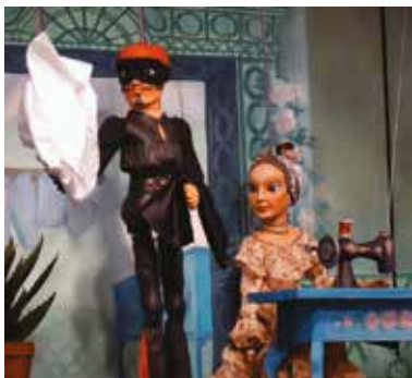
S inscenací Pozor, Zorro! vyrazilo plzeňské Divadlo ALFA na devítitýdenní cestu po Japonsku.

Na své doposud nejdelší zahraniční turné se Alfa vypravila s inscenací režiséra Tomáše Dvořáka Pozor, Zorro! , kterou nastudovala v japonštině. Součástí turné po mnoha japonských městech včetně Takasaki – partnerského města Plzně – je také prezentace na Velvyslanectví České republiky v Tokiu nebo účast na významných japonských festivalech. Rozsahem i prestiží je současné japonské turné největší v historii Divadla ALFA a je také jedním z nejrozsáhlejších zahraničních hostování na poli českého loutkového divadla vůbec. Alfa svými aktivitami dokazuje, že stojí na špičce světové loutkářské scény a významně prezentuje plzeňskou i českou kulturu po celém světě. Turné se koná v době divadelních prázdnin. Od října Alfa pozve do svého hlediště malé i velké diváky.