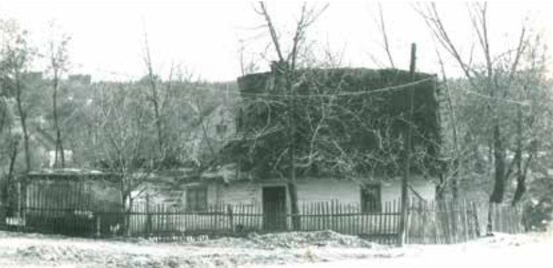
Takto to v Červeném Hrádku vypadalo ve 30. letech minulého století.

V blízkosti Červeného Hrádku se nachází řada mohyl ze střední doby bronzové a halštatské, zejména v plesí Černá myt. Dalšími usedlými zde byli až Slované v 8. století našeho letopočtu, kteří osídlili mj. Holý vrch u Bukovce a odtud pronikali i k dnešnímu Červenému Hrádku. První zpráva o obci je z roku 1384, kdy byl jejím majitelem Heřman z Hrádku. V následujících letech se majitelé často střídali. Označení Červený Hrádek je pro obec u Plzně použito prokazatelně až roku 1432 a váže se zřejmě k červené krytině střechy tvrze či menšího hradu. Město Plzeň koupilo statek Červený Hrádek až roku 1724. Od počátku 18. století dochází k růstu obce, k čemuž přispěla i raabizace a v letech 1811–1812 i výstavba císařské silnice z Prahy do Plzně v blízkosti vsi, při níž byla v roce 1812 postavena hrádecká hospoda a roku 1835 nová hrádecká myslivna. Od počátku 20. století se zde začali usazovat dělníci, kteří docházeli za prací do Plzně. Pracovali na tehdy zakládaném hřbitově, v cihelnách, ve stavebnictví, u kamenické firmy Cingroš, ve Škodovce, na dráze, na silnicích atd.