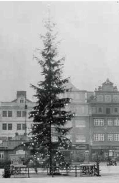
Na snímku Emanuela Balleye je ozdobený vánoční strom na náměstí Republiky v roce 1931. Zdroj: Západočeské muzeum v Plzni

Tradice stavění takzvaných vánočních stromů republiky je relativně mladá, sotva stoletá. Odvíjí se od už notoricky známé příhody, kdy Rudolf Těsnohlídek našel před Štědrým dnem roku 1919 v lese opuštěné děvčátko, které zachránil. Přemýšlel, jak pomoci dalším opuštěným dětem, a tak vznikla tradice zdobení velkých vánočních stromů na náměstích, pod nimiž byla umístěna kasička, kam lidé mohli vkládat své příspěvky. První takový strom byl postaven a ozdoben v Brně v roce 1924, Plzeň byla druhým městem. Vánoční strom stál