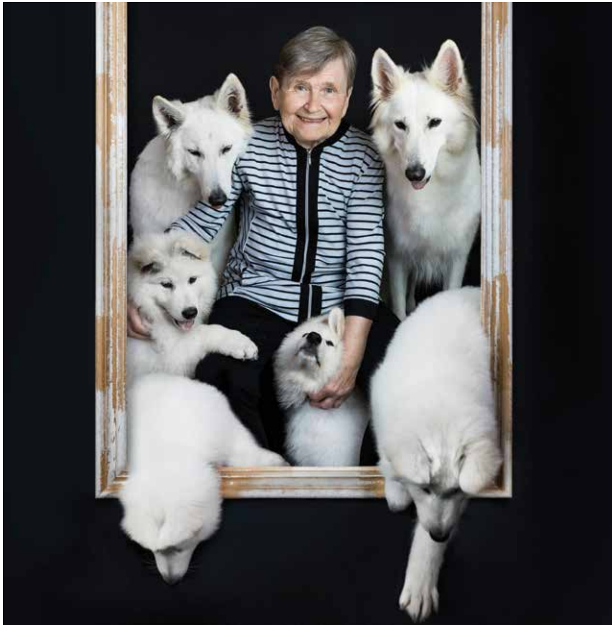
Ukázka z kalendáře, který vydala organizace Domovinka na rok 2022.