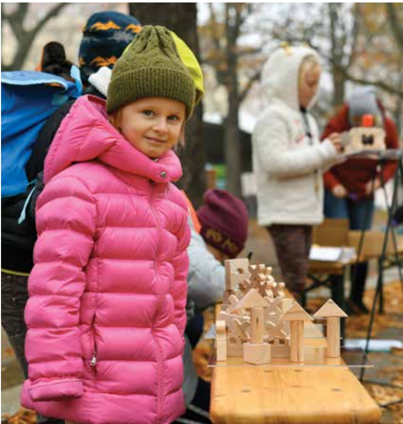
Jiráskovo náměstí během roku 2021 ožilo řadou akcí, na nichž se sešli nejen obyvatelé z jeho okolí. Snímek je z letošních Plzeňských oslav vzniku republiky.

Ve čtvrtek 17. června ožilo Jiráskovo náměstí díky olympiádě, kterou pořádala Akademie nadání. Během odpoledne si děti, teenageři i dospělí vyzkoušeli mnoho sportovních aktivit a her. Vzhledem k tropickému počasí připravili božkovští hasiči pro malé i velké sportovce příjemné osvěžení v podobě vodní clony. Účast byla obrovská. Sportovalo několik stovek dětí i dospělých.