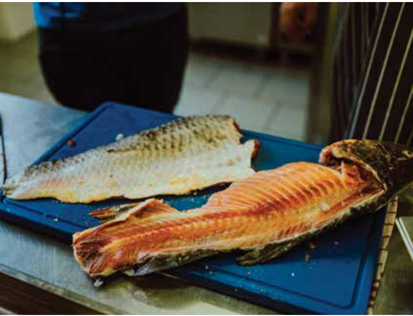
Z kapra se udělají filety (levý snímek). Na pravém snímku je zachycena konečná podoba štědrovečerního menu - smažených kapřích filetů s houbovým kubou.

Postup: Filety z kapra nakrájíme na menší porce, osolíme, obalíme v mouce a poté v hustějším těstíčku připraveném ze zbylé mouky, škrobu, vajec a piva. Rozhodně kapra vkládáme do rozpáleného oleje, nebude nasáklý tukem a těstíčko bude krásně křupavé. „Těstíčko můžeme dochutit třeba bylinkami nebo kořením. Pro dosažení křupavější a nadýchanější struktury do něj