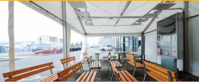
Klienti odboru registru vozidel a řidičů mohou čekat na Koterovské ve vyhříváném staně.

Magistrát města Plzně doporučuje všem klientům odboru registru vozidel a řidičů si svoji návštěvu objednat on-line pomocí aplikace www.uradbezcekani.cz a zkrátit tak své čekání na minimum. V aplikaci je možné zaregistrovat si termíny i na jiná magistrátní pracoviště. (haj)