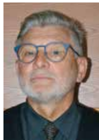
Antonín Herrmann Masarykova ZŠ Není asi žádným tajemstvím, že podzimní měsíce školního roku 2021/2022 patří k těm nejnáročnějším v historii českého školství. Jsme pochopitelně rádi, že se

neustálé změny, přijímáme je a učíme se s nimi žít.