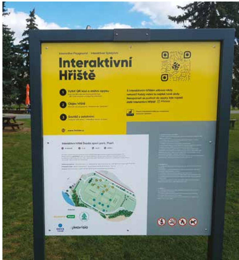
Slovanské iHřiště zve už celý podzim malé i velké nejen k pohybu, ale také k procvičení nejrůznějších znalostí.

Celkem je iHřišť v České republice pět desítek. Sportovní aktivity a soutěže se liší podle jednotlivých lokalit. Kromě pohybových aktivit, jako je workout, se děti mohou zapojit třeba do hledání pokladu, vyplňovat různé kvízy, hrát pexeso nebo se vypravit po naučné stezce. Mohou také běhat trasy mezi různými staništi. Aplikace tak procvičuje tělo i ducha napříč obory.