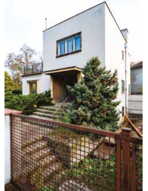
Vila Jiřího Freunda se nachází v městské památkové zóně Bezovka.

Nemovitou kulturní památkou je také předměstský dům U sv. Rocha v Plzni na Roudné. Nárožní, patrový, zděný, zčásti podsklepený dům postavený mezi lety 1837–1839 je kvalitním příkladem pozdně klasicistní architektury charakteristické pro původní zástavbu Saského Předměstí a je jedním z posledních dokladů tohoto typu malého bytového předměstského domu. Od roku 2021 je novými vlastníky realizována celková rekonstrukce domu, který získali v zanedbaném technickém stavu. Ještě před jeho vyhlášením nemovitou kulturní památkou prošel ne-