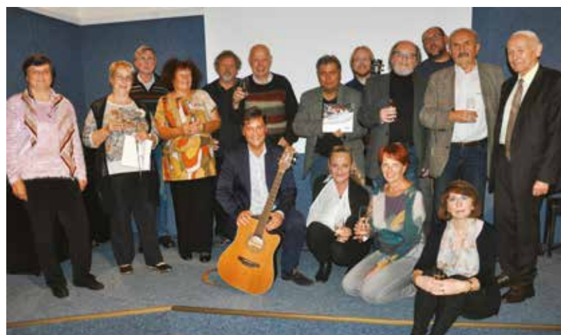
Akcí KPKK se účastnila celá řada plzeňských osobností.