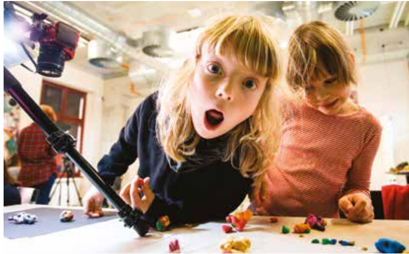
Návštěvníci Festivalu Animácie se mohou těšit na zajímavé filmové laboratoře.

Letošní festivalové téma filmová laboratoř inspirovalo především workshopy určené začínajícím filmařům i všem, kdo si chtějí filmové triky jen vyzkoušet. Animácie se vydá na průzkum původních ručních, až mechanických způsobů výroby filmových efektů, které mohou mít i v současné době své místo a kouzlo.