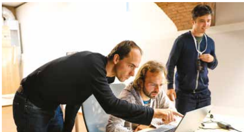
SIT Port propojuje městské organizace s nadanými studenty, kteří pomáhají hledat řešení jejich problémů

A třeba Městská policie Plzeň pak nabízí spolupráci na systému pro automatické vyhodnocování situací v provozu, konkrétně jde o složitou problematiku rozhodování o odtahu vozidel z důvodu vytvoření překážky v provozu, která může být například