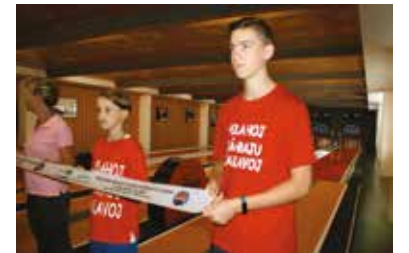
TJ Slavoj, z. s., uvedla do provozu novou kuželnu.

TJ Slavoj Plzeň ve svém areálu v Třebízské ulici otevřela zrekonstruovanou kuželnu, která nyní patří k nejmodernějším v České republice.