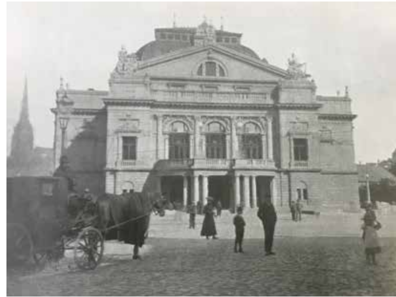
Budova Velkého divadla v Plzni byla otevřena před 120 lety.

Co bylo před více než 120 lety v místě, kde se nyní tyčí budova Velkého divadla? Mohlo mít divadlo jinou podobu? Kolik výstavba stála a jak dlouho trvala? To jsou některé z otázek, na něž odpovídá výstava umístěná na terase této novorenesanční budovy, kterou navrhl architekt Antonín Balšánek, i v jejích interiérech. Vernisáž se konala přesně v den, kdy před 120 lety poprvé zasedli do hlediště Velkého divadla diváci, aby se zaposlouchali do tónů Smetanovy Libuše, tedy v úterý 27. září 2022.