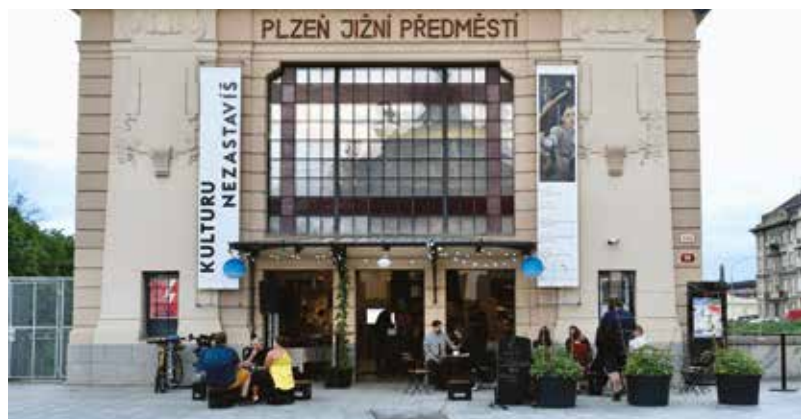
Moving Station na Jižním Předměstí nabízí především autorskou tvorbu nezávislých umělců.