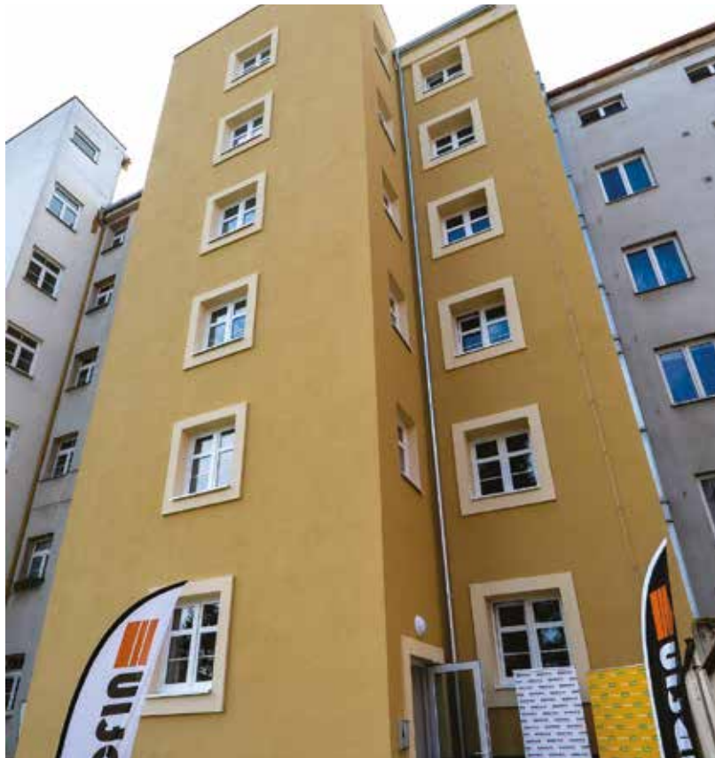
Z objektu bývalé ubytovny v Plachého 52 vybudovalo město Plzeň bytový dům se 14 byty určenými pro lidi v tíživé situaci i pro samoživitele a mladé rodiny.

„V prvním nadzemním podlaží jsou dva byty o dispozici 2+kk, které slouží k přechodnému ubytování. Jsou určeny lidem, kteří se dostali do nečekané životní situace, již nejsou schopni řešit vlastními silami, a potřebují bydlení na přechodnou dobu. Dostane se jim podpory od sociálních pra-