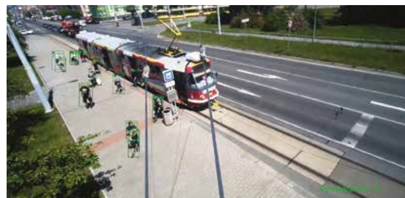
Plzeňská firma Amitia vyvíjí systémy, jež jsou schopny analýz pohybu chodců i automobilů a zjišťují zdroje zácp v městském prostředí.

Druhou významnou oblast, která se zaměřuje na obce a státní správu, tvoří automatické zpracování dokumentů. „Pro zpracování dokumentů nabízíme systém, který umí automaticky určit typ dokumentu a vytěžit z něho potřebné údaje. Toto řešení se hodí především tam, kde je vyžadováno velké úsilí k opakovanému přepisování údajů z většího množství dokumentů různého typu. Umíme si poradit i s ručně psanými texty. Chytrá města mohou například ocenit řešení pro online publikování obecních kronik s funkcionalitou vyhledávání informací v ručně psaných textech,“ uzavřel Milan Legát.