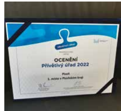
Magistrát města Plzně získal titul Přívětivý úřad Plzeňského kraje.

Spolu s výsledky soutěže je každoročně zveřejněna i sbírka příkladů dobré praxe. (red)