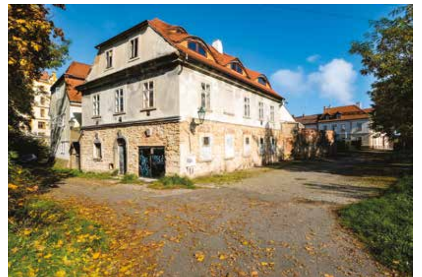
Předměstský dům U sv. Rocha stojí na Roudné a je ukázkou pozdně klasicistní architektury.

vhodnými úpravami, které nyní chtějí noví majitelé napravit. Začnou rozsáhlými sanačními opatřeními, město Plzeň jim poskytne dotaci ve výši 300 tisíc korun. Dotace jsou poskytovány v souladu se zákonem o státní památkové péči – v odůvodněných případech lze poskytnout příspěvek na zvýšené náklady spojené se zachováním a obnovou kulturní památky. (red)