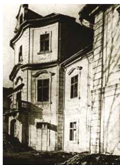
Na historickém snímku je zachyceno průčelí zámku v Malesicích.