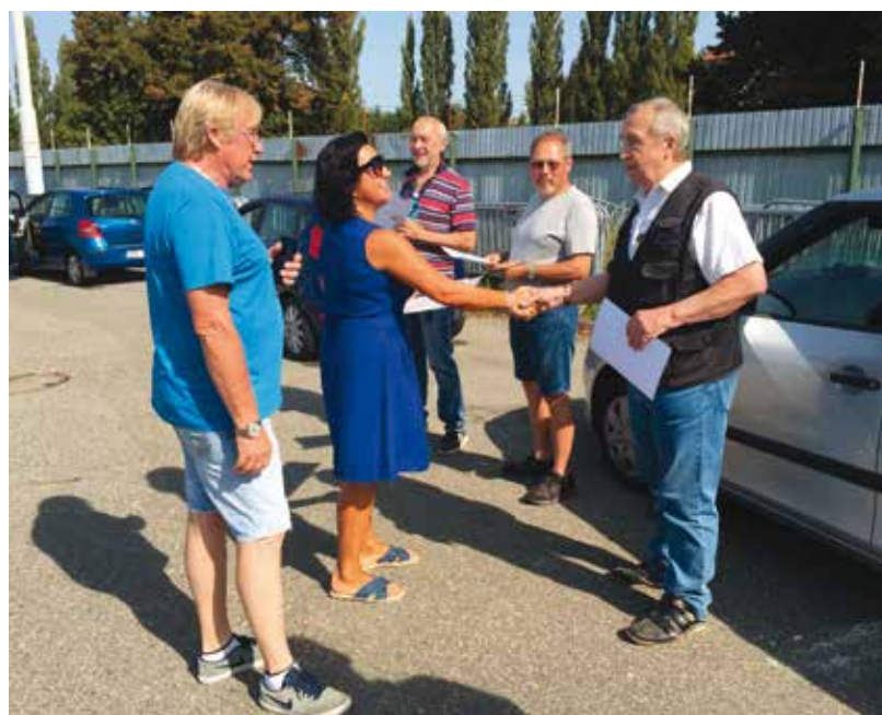
Pokračování projektu Prostě pořád řídím je naplánováno na jaro příštího roku.