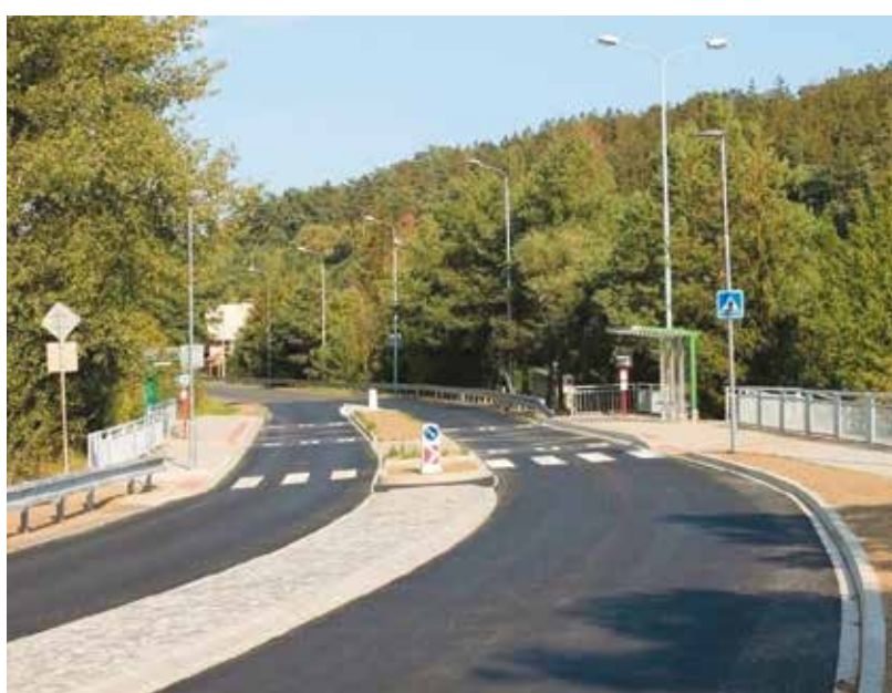
Autobusové zastávky Rozcestí Podhájí jsou po rozsáhlých úpravách pro chodce bezpečnější.

Nově upraveny jsou i zastávky Pod Zámečkem v ulici V Radčicích v městské části Radčice. Leží při velmi frekventované silnici, kde byla ještě donedávna povolená rychlost 90 kilometrů za hodinu, nyní je o 20 kilometrů snížena. „V původním stavu byly zastávky bez nástupiště, bez vhodného přístupu a s provizorním přístřeškem pouze ve směru do Plzně. Zastávka směrem do Radčic se nacházela přímo v napojení boční komunikace. Nyní mají v obou směrech standardní nástupiště. Na komunikaci směřující ke škole Zámeček jsou napojeny krátkými chodníky, doplněno bylo místo pro přecházení přes silnici a také nové veřejné osvětlení,“ uvedla Andrea Fojtíková. Úpravy za 2,8 milionu korun přispějí ke větší bezpečnosti. (red)