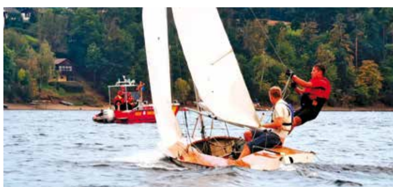
Závodu, který v říjnu na hracholuské přehradě pořádal Jachetní klub Plzeň, se zúčastnilo 34 posádek.