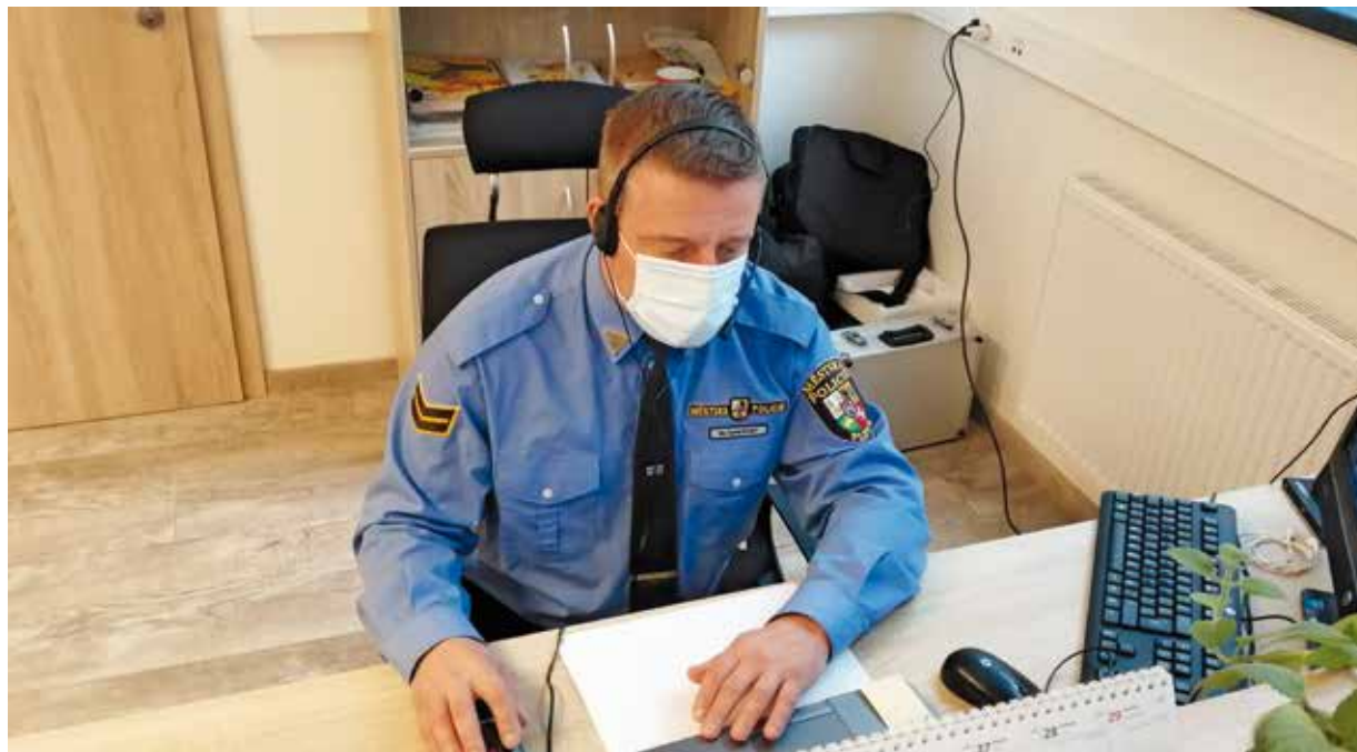
Strážníci Městské policie Plzeň pomáhají s trasováním kontaktů lidí nakažených koronavirem.

Fakultní nemocnice (FN) Plzeň otevřela ve svém areálu v Plzni na Borech nový urgentní příjem. Jde o specializované pracoviště s nepřetržitým provozem a jsou zde ošetřeni všichni pacienti s interními či plicními obtížemi nebo s podezřením na covidovou nákazu. Podrobnosti vzniku tohoto pracoviště popsal ředitel FN Václav Šimánek: „Tato rozsáhlá přeměna původních prostor ambulantního traktu na nový urgentní interní příjem trvala pouhé tři týdny a náklady byly ve výši cca jeden milion korun. Byly instalovány nové rozvody kyslíku, přípojky elektřiny, nové technologie pro komunikaci, kamery, počítače a monitory, vyšetřovací lůžka. Na místě jsou dostupné základní diagnostické technologie (mobilní RTG, sonograf) a k CT vyšetření budou pacienti převáženi do vedlejšího pavilonu podzemní spojovací chodbou. Děkuji všem zaměstnancům, kteří se tohoto velkého úkolu zhostili a během krátké doby vytvořili moderní příjmové pracoviště, které je v této složité době pro nemocnici našeho formátu nezbytností.“