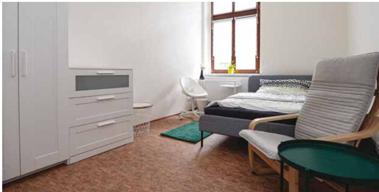
Sdílené byty ve Veleslavínově ulici jsou vybaveny novým nábytkem.

Každý z bytů má 5 samostatných pokojů. Jsou neprůchozí a zajišťují tak klientům soukromí. V bytech je dále společenská místnost s kuchyňským koutem, dvě koupelny, dvě toalety a prádelna. Byt v prvním patře domu je obsazen aktivními seniory a je v nájmu Obytné zóny Sylván, a. s. Byt ve druhém patře je obydlen mladými lidmi, kteří začínají svůj samostatný život po opuštění dětského domova. Tento byt je v nájmu Domovinky – sociální služby, o. p. s. „Je to necelý rok, co jsem myšlenku sdíleného bydlení seniorů a mladých lidí z dětských domovů vypustila do světa. Moc děkuji městu, s jakou rychlostí se celého projektu ujalo. Díky lidem na správném místě jsme celý projekt společně dopilovali do současné podoby. Propojovat generace je totiž velmi důležité. Pevně doufám, že