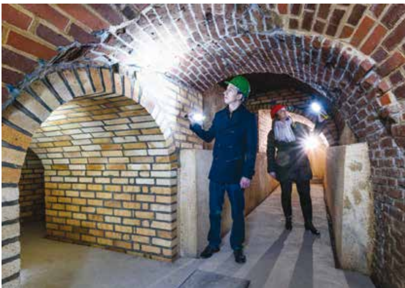
Plzeňské historické podzemí má mimo jiné i speciální prohlídkovou trasu přístupnou za svitu baterek.

Aktuální informace najdete na webu www.prazdrojvisit.cz .