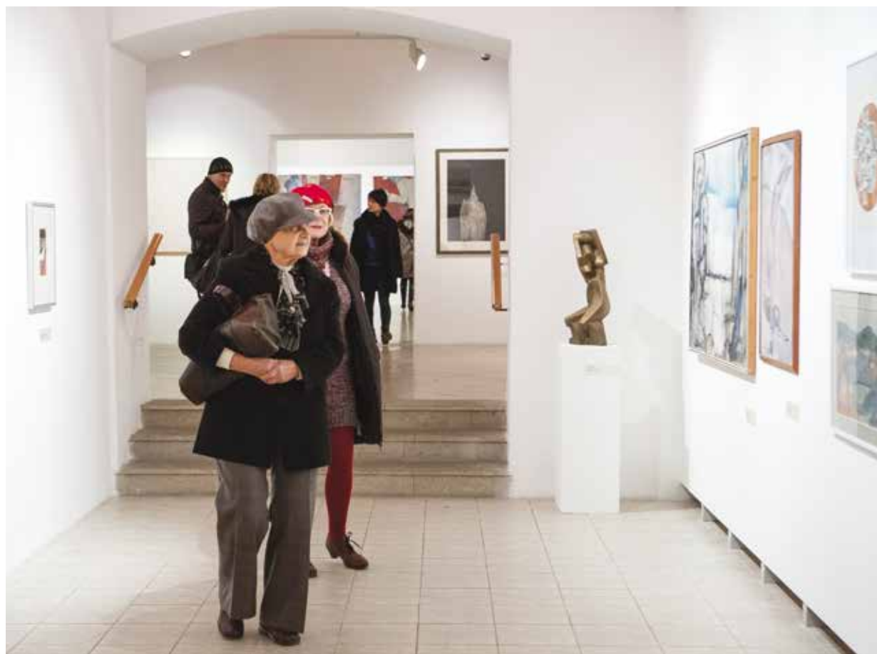
Takto to v Galerii města Plzně vypadalo před pěti lety, kdy si výstavou plzeňská artotéka připomínala 20 let své existence.

„Na výstavě 25 let Artotéky města Plzně bude v hlavní výstavní síni v přízemí Galerie města Plzně prezentováno 34 děl