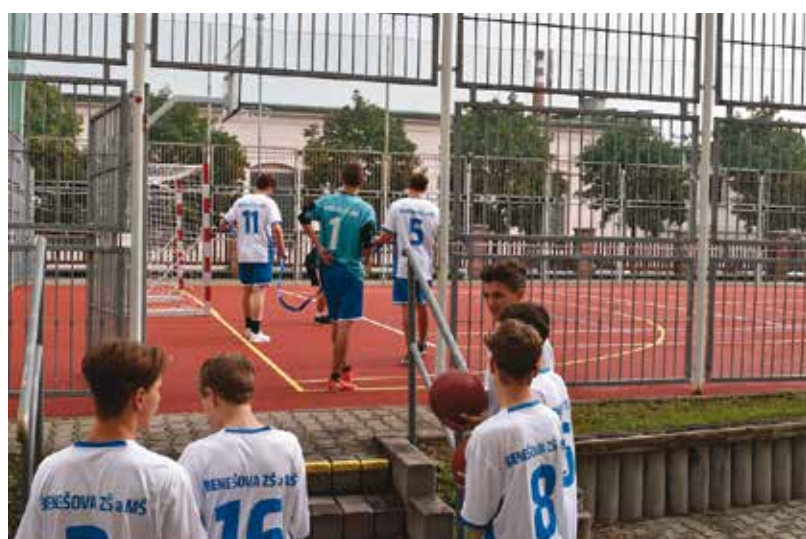
Žáci Benešovy základní školy v Plzni Doudleveckých mají opravené hřiště. Využívat ho může i veřejnost.