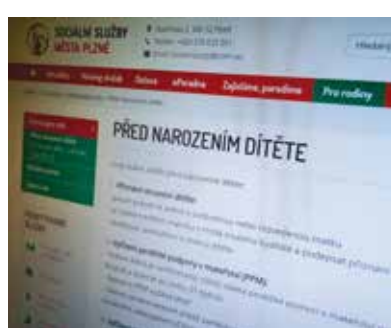
Webová stránka socialnisluzby.plzen.eu, na níž nyní najdou potřebné informace i rodiny s dětmi.

První okruh s názvem Potřebujete info nabízí přehled, co je nutné zařídit před narozením dítěte a po něm, dále pak seznam jeslí, mateřských a základních škol, státních i soukromých, na území města Plzně. Druhý okruh označený Hledáte pomoc obsahuje podokna Tíživá životní situace a Instituce, kde je možno dohledat, na kterou z institucí se obrátit s žádostí o jakoukoliv pomoc. Zajímá vás je poslední ze tří okruhů, obsahuje spektrum informací o tom, co se aktuálně děje v Plzni a nabídku volnočasových aktivit vhodných právě pro rodiny s dětmi.