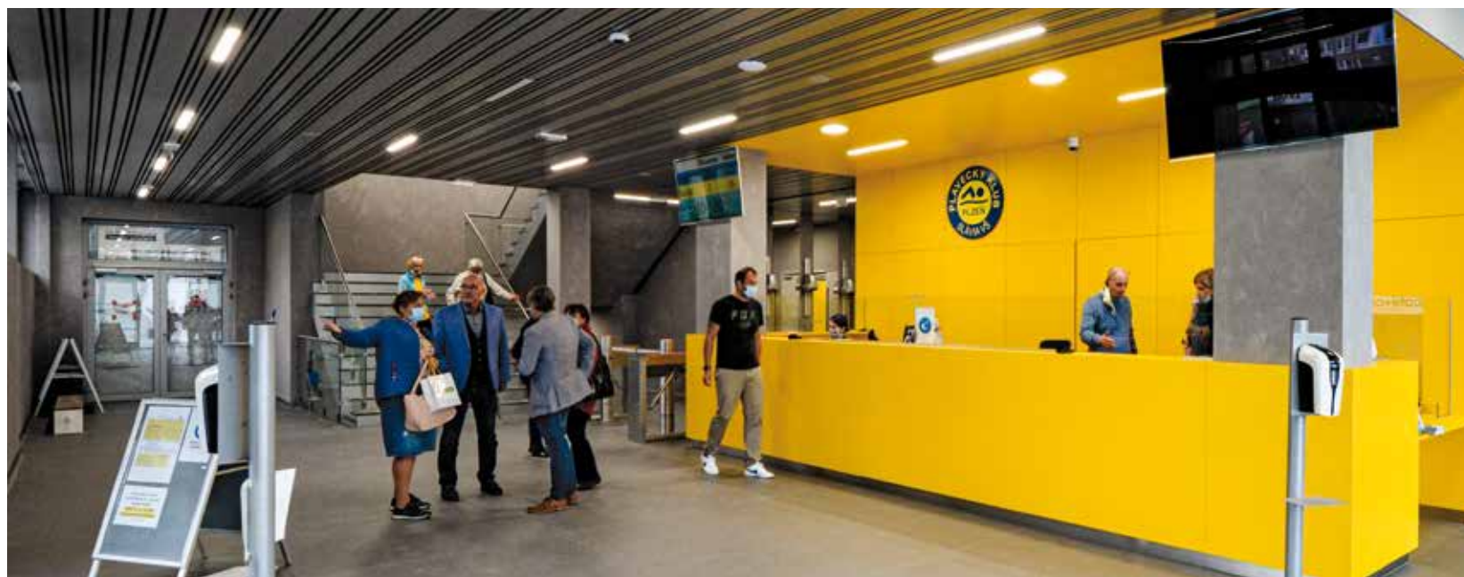
Od začátku října vcházejí návštěvníci městského bazénu na Slovanech moderní vstupní halou s bezbariérovým přístupem.

Vstupní hala má bezbariérový přístup, nové jsou i šatny