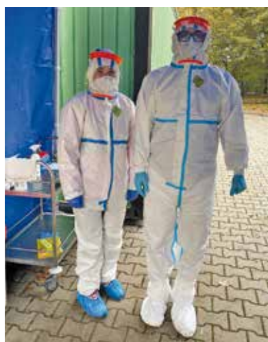
Do pomoci se už zapojili studenti Fakulty zdravotnických studií. Pracují například na odběrových místech.

„Velmi si vážíme všech lidí, kteří nabídli pomoc fakultní nemocnici. Nabídky našich spoluobčanů členíme dle jejich profesí či zájmovosti a zároveň zjišťujeme potřeby našich provozů. Doba je hektická a každým dnem se mění nejen počet pa-