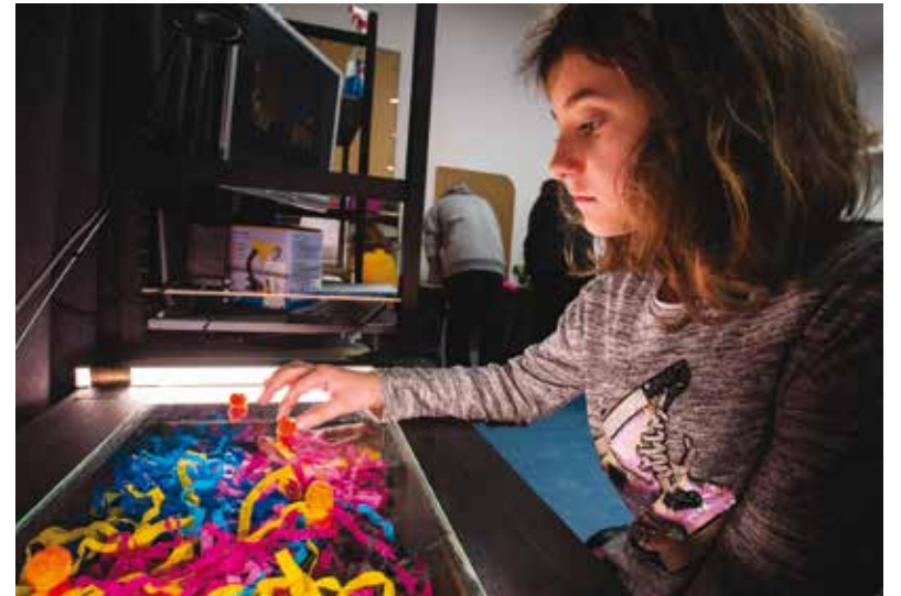
Workshopy Animácie budú mať i on-line podobu.