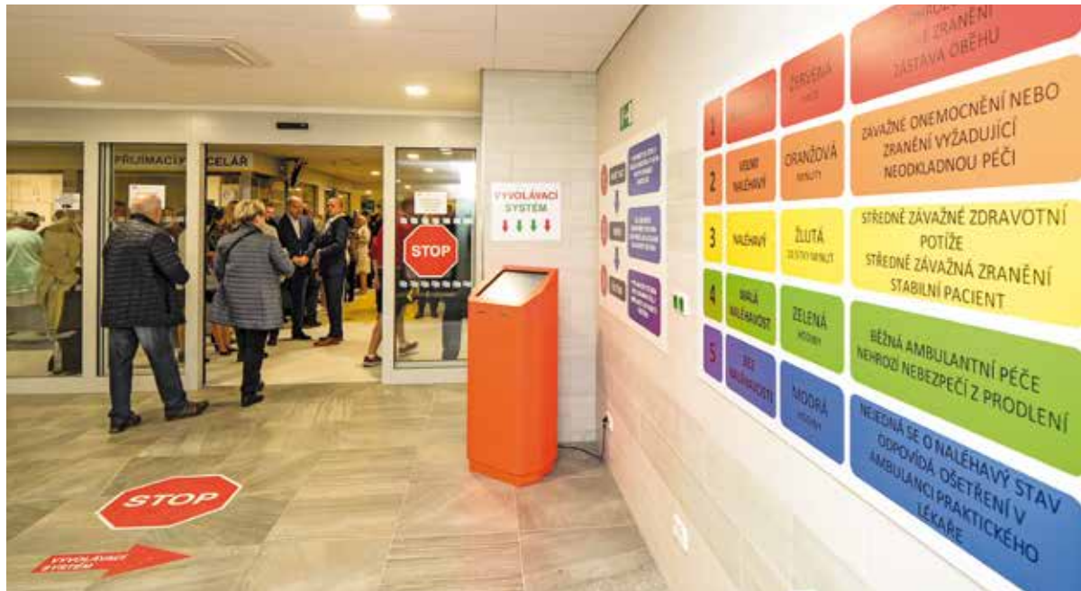
Největším přínosem je nový vyvolávací systém, který urychlí potřebná vyšetření.