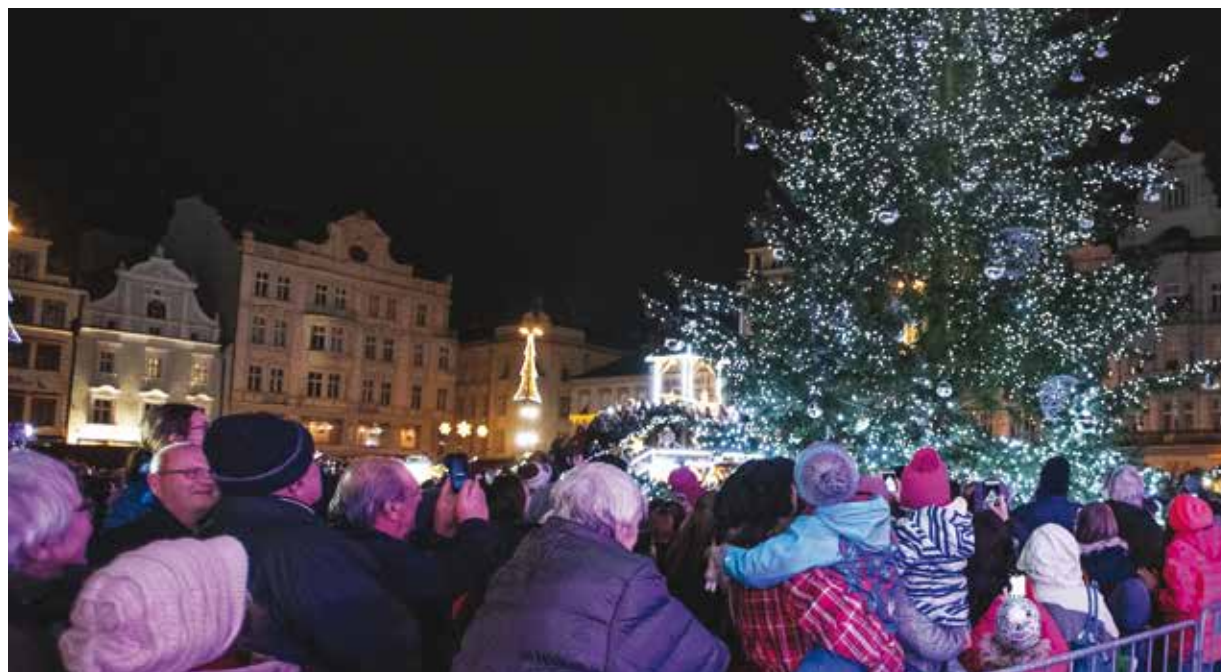
Na náměstí Republiky se rozsvítí vánoční strom s novými ozdobami. Laděný bude opět do modra.