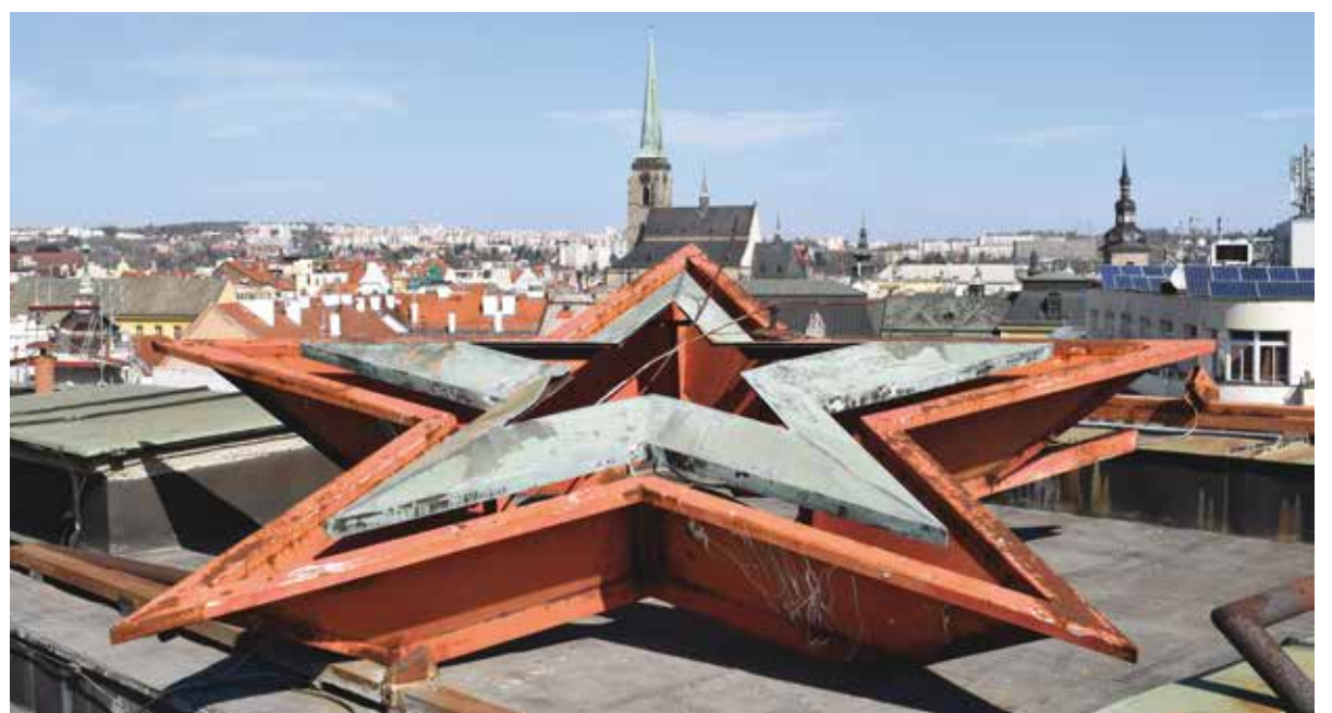
Jedinečná a neopakovatelná performance v režii Michala Cabana je připravena na závěr svátečního dne od 17:30 hodin v blízkosti Americké 42, bývalého sídla KV KSČ.