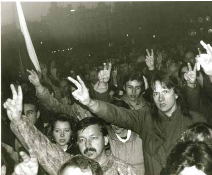
V mázhauzu radnice budou k vidění autentické záběry z listopadu 1989.

dobu typickou hradbou, která bude polepena dobovými fotografiemi. Nebude sloužit jen pro vzpomínky, ale i pro jakoukoli reflexi či úvahu.