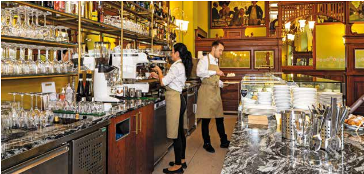
V opravené kavárně je připravena široká nabídka nápojů, čerstvých pokrmů i lahodné kávy.

Stavební úpravy přišly město Plzeň na 1,6 milionu korun, provozovatel budovy (Měšťanská beseda s.r.o.) vynaložil 4,3 milionu na vnitřní vybavení a bar.