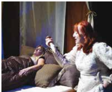
Spáčka a vřeteno.

Dlouhodobě nejsledovanějšími představeními Divadla Alfa jsou Tři mušketýři, motorkářská pohádka pro nejmenší děti Tři siláci na silnici a Alfa Farma, inspirovaná Orwelovým románem Farma zvířat. Diváci mají velký zájem i o představení Kde domov můj?, které zachycuje posledních 100 let Československa a Česka pohledem jedné plzeňské rodiny. U nejmenších dětí je stálým hitem Perníková chaloupka.