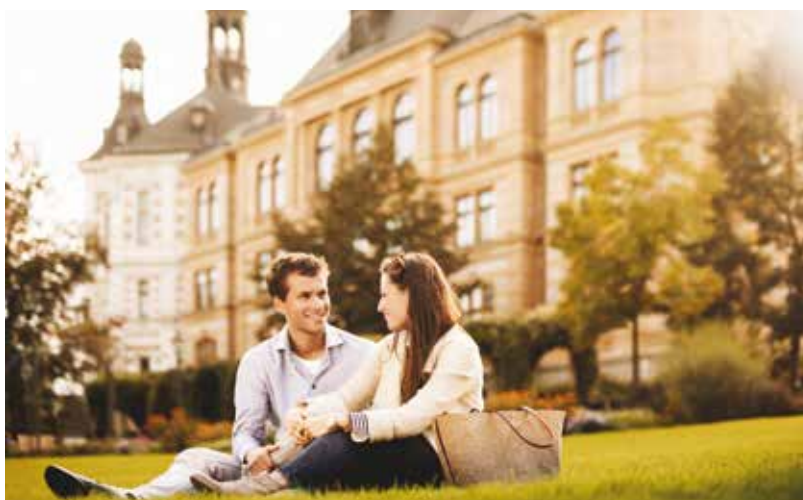
Plzeňanům se líbí nabídka kulturního vyžití, zeleň a MHD.

Velmi kladně bylo hodnoceno životní prostředí ve městě, u kterého respondenti nejčastěji oceňovali úroveň péče o veřejné plochy a také dostupnost odpočinkových prostranství, jako jsou hřiště či parky. Dalším z témat v dotazníku byla městská hromadná doprava, u které mohli občané ohodnotit například dostupnost zastávek, čistotu vozů či intervaly mezi spoji a jejich návaznost. V celkovém hodnocení spokojenosti MHD dosáhla výborného výsledku, více než 84 procent respondentů je