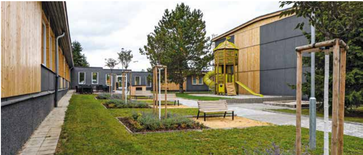
Venkovní úpravy areálu si vyžádaly 6,77 milionu korun, nové dětské hřiště stálo 934 tisíc.

Město získalo areál zpět do svého užívání (po předchozích pronájmech)