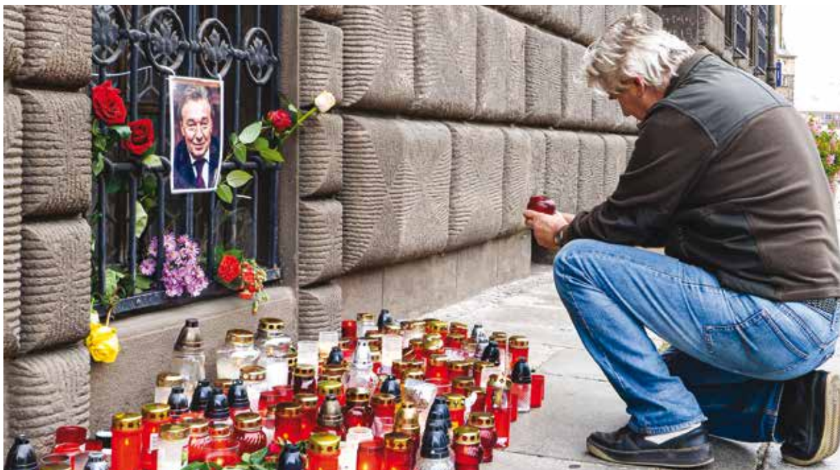
Před radnicí na náměstí Republiky zapalovali lidé svíčky.

Před svým plzeňským koncertem, který se konal 19. listopadu 2014, poskytl Karel Gott Radničním listům rozhovor,