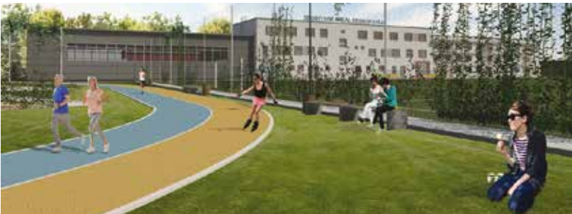
Při přestavbě vznikne nová in-line dráha dlouhá 302 m. Vizualizace: ARCHDYNAMIC s.r.o.

Plzeň zrevitalizuje sportovní areál Prokopávka v Bolevci. Stavební práce potrvají dvacet měsíců a město na ně v rozpočtu počítá s 226 miliony korun včetně DPH.