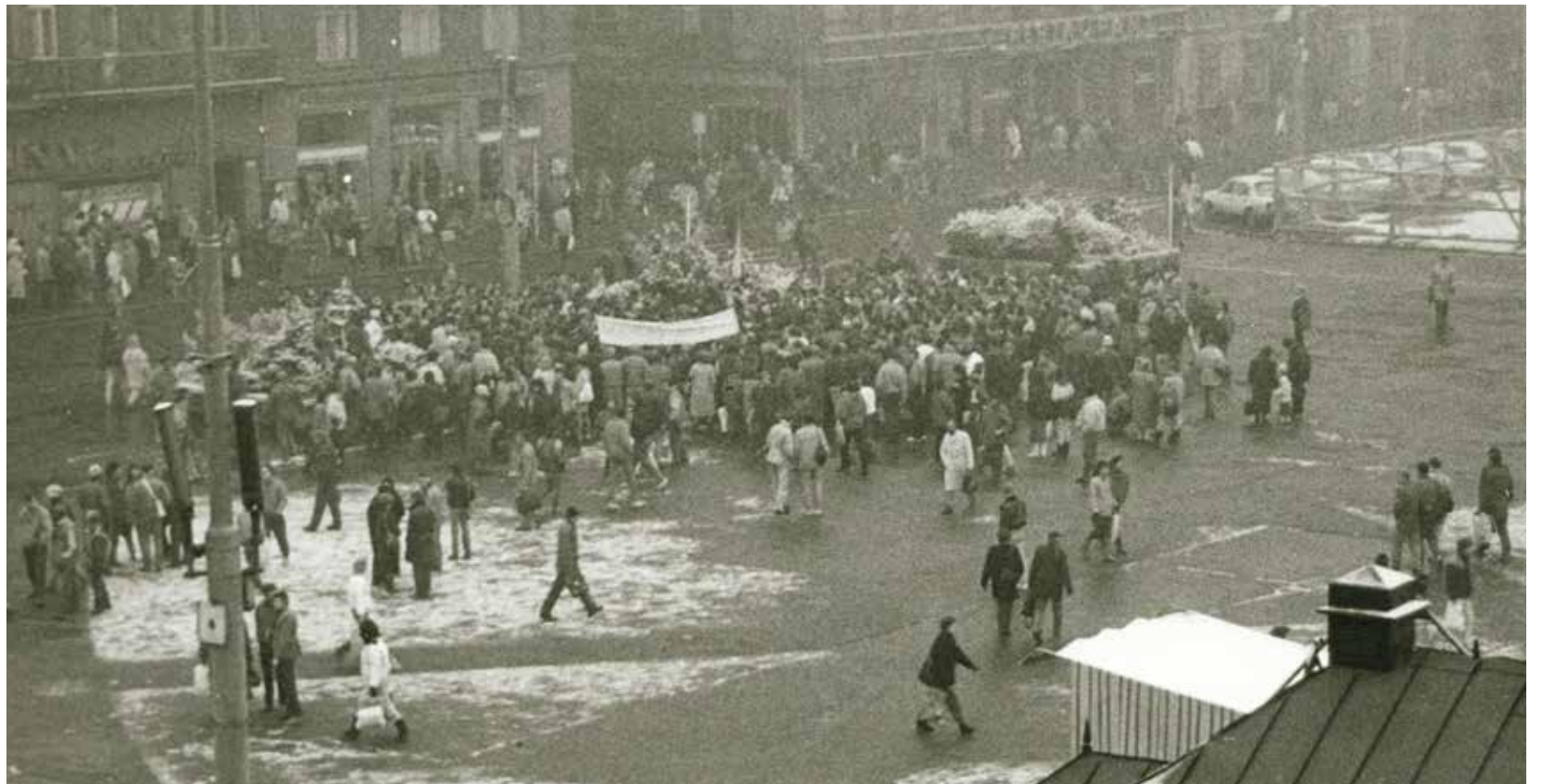
V jihozápadním rohu náměstí Republiky se před třiceti lety promlouvalo k demonstrujícím. Ted bude toto místo sloužit ke vzpomínkám, reflexím a úvahám.

V jihozápadním rohu náměstí Republiky, v místě, kde se v roce 1989 promlouvalo k demonstrujícím, vznikne řečníště, oběhnané z jedné strany pro tehdejší