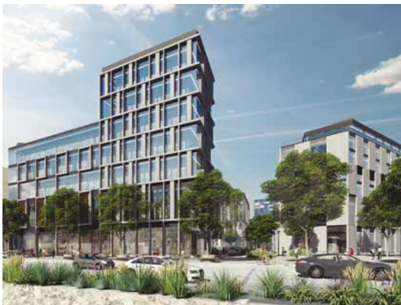
Ulice pro pěší doplní náměstí i prostory pro zábavu a volný čas. Vizualizace: Amesi-de, a. s.

Lokalita vymezená Americkou třídou, Sirkovou ulicí a Denisovým nábrežím je jedním z nejdůležitějších území v centru města. Měla by tu vyrůst nová čtvrť s kvalitním veřejným prostorem, volnočasovými aktivitami, byty, kanceláři i obchody, a to dle městem stanovených podmínek.