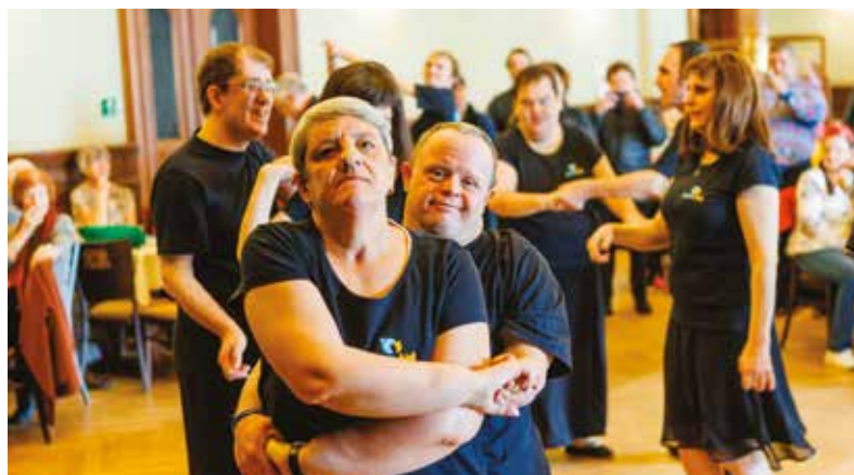
Lidé se zdravotním znevýhodněním ukázali své dovednosti na festivalu UMÍÍÍ!