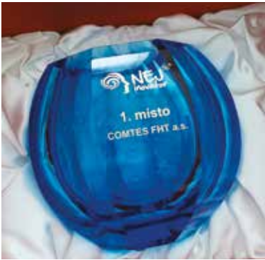
Hlavní cena pro firmu COMTES FHT a.s. byla vyrobená ve sklárnách Moser.

Firma COMTES FHT a.s. se sídlem v Dobrušce zvítězila v soutěži na podporu malých a středních inovativních podniků – NEJ inovátor 5G – vyhlášené Odborem Smart Cities a podpory podnikání Magistrátu města Plzně. Do užšího výběru bylo nominováno 18 firem.