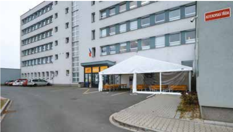
Odbor registru vozidel a řidičů Magistrátu města Plzně sídlí na Koterovské.

K další statistice odboru registru vozidel a řidičů patří i výše financí vybraná na správních poplatcích. Loni na nich bylo vybráno 51 milionů korun. (red)