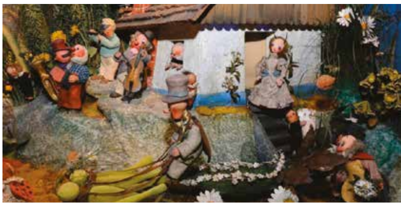
Trnkovo loutkové dioráma Svatba u Broučků bude v Plzni minimálně deset let.

K dalším zajímavým aktivitám Muzea loutek patří edukační a zážitkové programy. Zájemci, především z řad mateřských i základních škol, si už nyní mohou pro své žáky vybírat z programů Rošťáci z Muzea loutek a Příběh na niti . V nabídce je