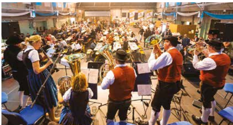
Hudba, pivo, pochoutky a dobrá nálada. To vše si lidé mohou užít na festivalu v areálu DEPO2015.

Zazní hudba mnoha žánrů – od tradiční české i bavorské dechovky přes rock'n'roll či flétnový koncert. Ve velké autobusové hale v sobotu 23. dubna večer vystoupí proslulá bavorská páty kapela The Heimatdamisch . Plzeňskou