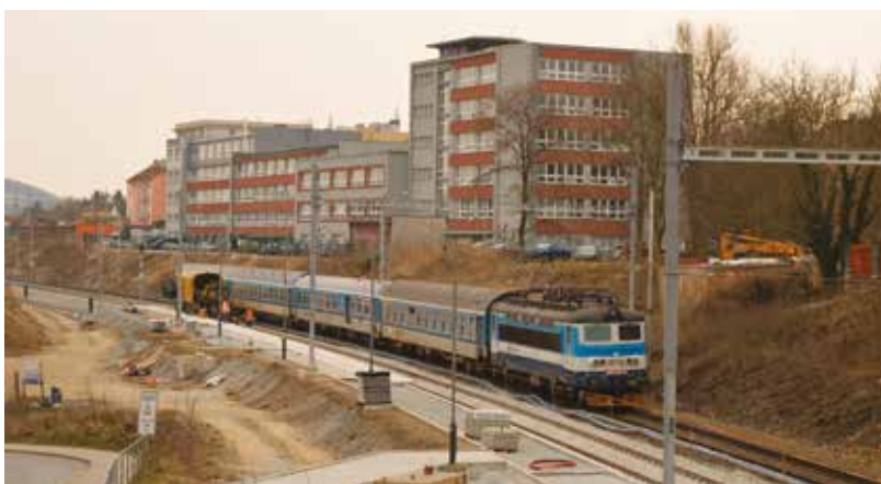
Během března vrcholily stavební práce na nové zastávce Plzeň-Slovany.