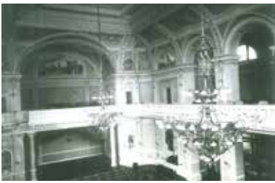
Velký sál v Měšťanské besedě.