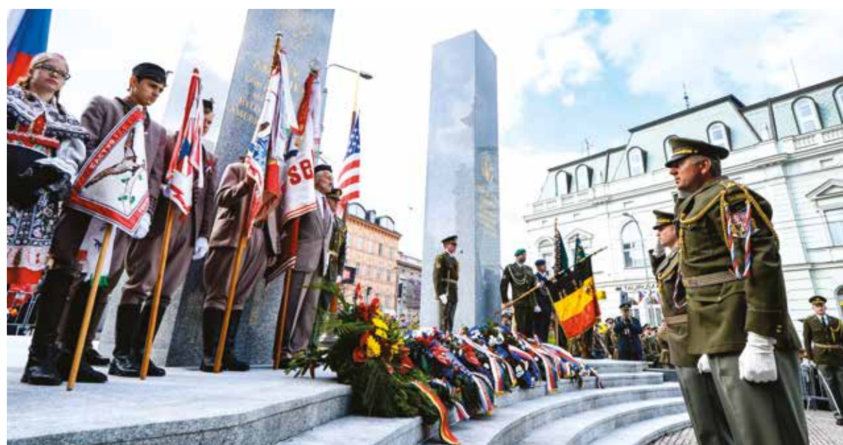
U pomníků, které připomínají, že Plzeň v květnu 1945 osvobodila spojenecká vojska, se budou letos konat pietní akty za účasti široké veřejnosti.

Část vojensko-historického programu se vzhledem k revitalizaci parku za Obchodním centrem Plzeň Plaza přesouvá do sadového okruhu a nově také do lokality U Ježiška. Šafaříkovy a Křižíkovy sady včetně Proluky obsadí Klub vojenské historie Tommy & Yankee a Klub vojenské historie 16. obrněné divize. Připravena je také interaktivní stezka pro rodiny s dětmi, která v sobotu 7. května propojí jednotlivé kempy v centru města. U Ježiška se představí Kombinovaný oddíl reprezentující odkaz Československé samostatné obrněné brigády se zahraničními účastníky z Holandska, Anglie a Slovenska, kteří přijedou s vojenskou technikou. „V premiéře tady návštěvníci uvidí zrekonstruovanou ambulanci Austin K2/Y. Právě tento typ sanitky řídila ve válce tehdy ještě princezna Alžběta. Své zázemí bude mít U Ježiška