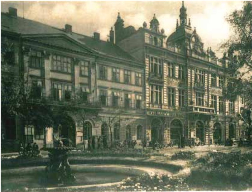
Měšťanská beseda na dobovém snímku.