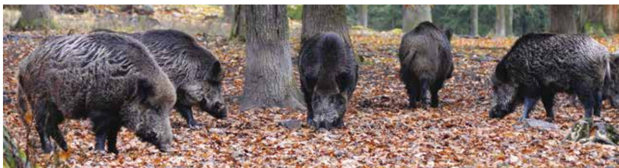
Plata divočáků dokáže rozrýt travnaté části parku nebo hřiště.

Ultrazvukové zařízení se už osvědčilo v Borském parku