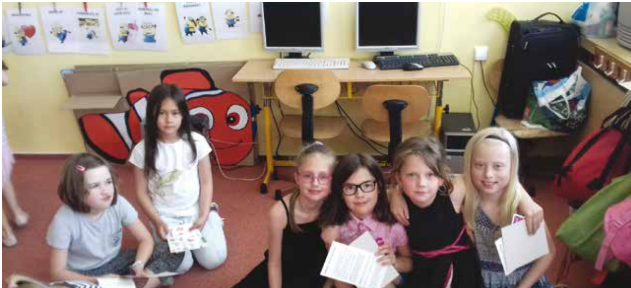
Na archivním snímku žáci 7. základní školy a mateřské školy v učebně s počítači, jejíž datové sítě se měnily loni.

„Rekonstrukce datových sítí je důležitá, a to z několika hledisek. Sítě vznikaly zhruba před deseti lety a většinou si je školy tvořily nekoordinovaně samy, v dnešní době však již neodpovídají požadavkům na moderní výuku. Technologie jde mílovými kroky dopředu, v učebnách je nedostatek zásuvek a zastaralá síť má negativní vliv na rychlost a spolehlivost spouštěných výukových programů,“ vysvětluje Bohuslav Horais, vedoucí Úseku podpory uživatelů Správy informačních technologií města Plzně. Obnova datových sítí se loni uskutečnila v Bolevecké základní škole, 2. základní škole, 7. základní a mateřské škole, 14. základní škole, 34. základní škole, Základní a mateřské škole v Božkově a Základní