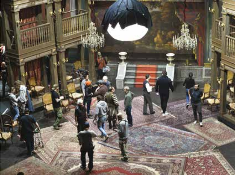
Francouzští filmaři včetně českého komparzu ve Velkém divadle při natáčení filmu Edmond.

Samotný filmový štáb čítá na 120 lidí. K tomu ale ještě navíc patří zástupy komparzistů a účinkujících.