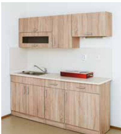
Vybavení kuchně v novém sociálním bydle.

„Měsíční nájemné v městských bytech se pohybuje od 40 korun do 82,1 korun za metr čtvereční, přičemž komerční