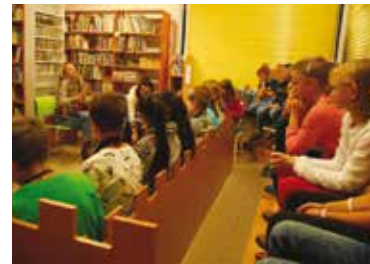
Přednáška v knihovně.

Celostátní projekt Březen – měsíc čtenářů vyhlásil letos už podeváté Svaz knihovníků a informačních pracovníků (SKIP) a je určen i lidem, kteří do knihovny zatím nechodí. V rámci podpory čtenářské gramotnosti se na něm podílí více než 400 aktivních veřejných knihoven z celého Česka.