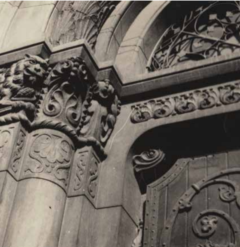
Detail vchodu do kostela sv. Jana Nepomuckého.