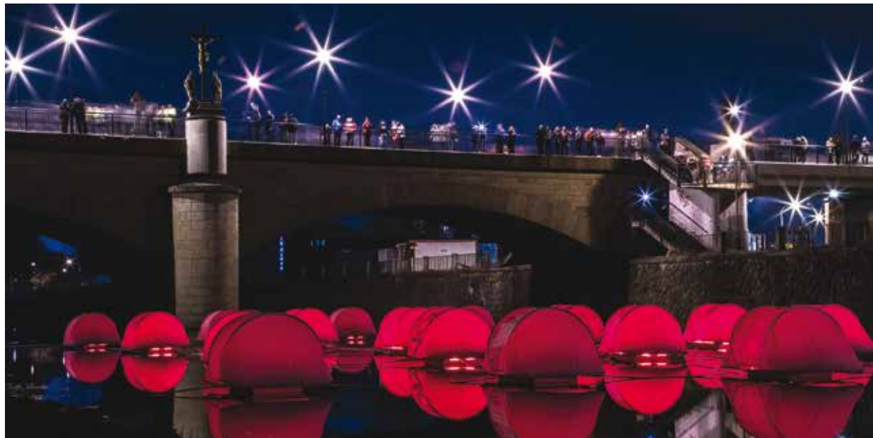
Ilustrační foto z loňského ročníku festivalu.

Tradiční akce s názvem Blik Blik se koná už počtvrté a tentokrát na Slovanech