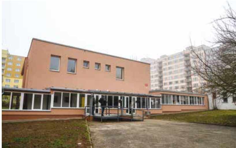
Na snímcích pohled na budovu školy a do dětské herny.

Součástí projektu za 20 milionů korun bylo zateplení objektu i výměna oken