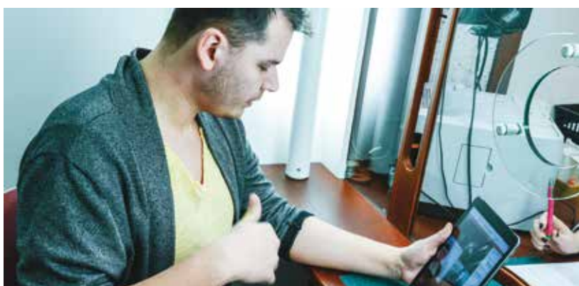
Ukázka nové služby pro neslyšící.

Občané se sluchovým postižením si tak mohou pohodlně a důstojně vyřešit na magistrátních úřadech například občanský či řidičský průkaz, cestovní pas nebo živnostenský list, a to výrazně jednodušším způsobem. Objednat se na úřední jednání s pomocí online tlumočníka je podle Bohuslava Horaise, vedoucího úseku podpory uživatelů Správy informačních technologií města Plzně, která zajišťuje provoz, velmi jednoduché. „Na webových stránkách jednotlivých pracovišť bude uveřejněn e-mailový kontakt na odpovědného pracovníka. Tomu stačí poslat zprávu s požadavkem na