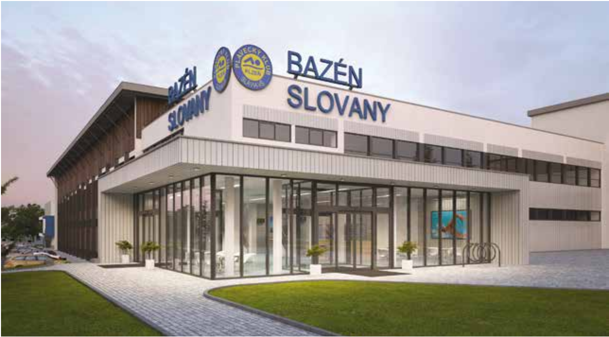
Na snímku vizualizace bazénu po dokončení rekonstrukčních prací.

Letos by měl být dokončen také projekt na komplexní rekonstrukci a přestavbu sportovního areálu Prokopávka. A tak by se už v září mohlo začít stavět, celá stavba si vyžádá cca 174 milionů korun a hotová by měla být do roku 2020. „Počítá se s rekonstrukcí stávající tělocvičny, fotbalového hřiště, vybudováním malé tělocvičny na box, s beachovými kurty, in-line dráhou, víceučelovými venkovními hřišti, ubytovnou, restaurací, prostě kompletním zázemím včetně parkoviště,“ vypočítává Veronika Krupičková. Investice ve výši 120 milionů