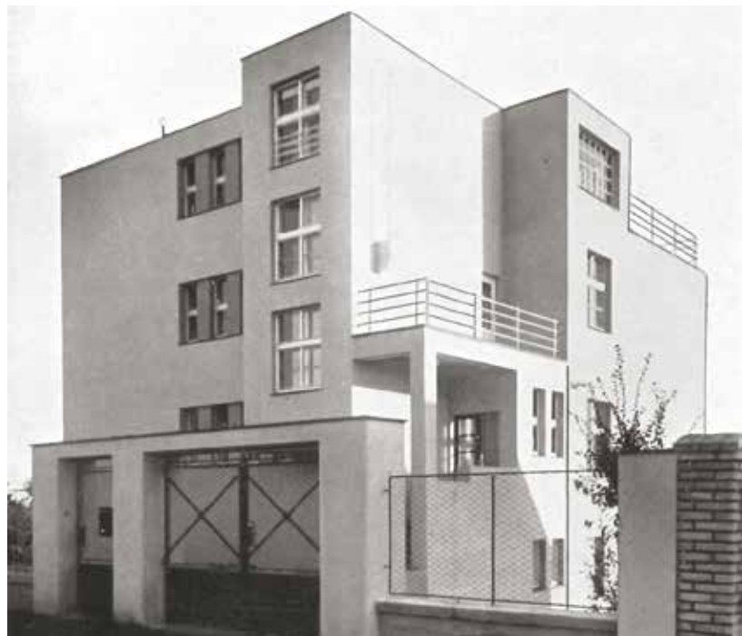
Ukázka plzeňské architektury z období 1918 až 1938. Vila Václava Ornsta na Lochotíně.

První kompletní zpracování architektury Plzně předválečného období představí výstava nazvaná Pracovna republiky. Architektura Plzně v letech 1918–1938. Koná se ve výstavní síni „13“ Západo-