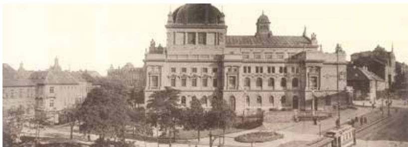
Nové městské divadlo.

Na konci 18. století vystupovaly v Plzni německé kočující společnosti. Představení byla pořádána v sále Řihovského domu, na radnici, v hostincích U Bílé růže a U Zlatého orla. Schantrochova společnost při svém hostování mezi léty 1811–1819 uvedla poprvé v Plzni zpěvohry. Národněobrozené snahy byly podporovány především vlasteneckým profesorem zdejšího gymnázia Josefem Vojtěchem Sedláčkem. V dubnu 1818 v Plzni poprvé zjeviště zazněla čeština. Důkazem sílící vlastenecké aktivity českých ochotníků bylo uvedení hry Osvobození Plzně od táboritů v roce 1834 u příležitosti Nového svátku v květnu 1818 v sále radnice. Po nástupu purkmistra Martina Kopeckého v roce 1828 bylo rozhodnuto o přestavbě městské školy „štitů“, stojící mezi kostelem sv. Bartoloměje a radnicí, na městské divadlo. Pro zchátralost však musela být v roce 1829 zbourána a bylo rozhodnuto o výstavbě nového městského divadla, prvního kamenného divadla po Praze. Správa byla svěřena právovárečnému měšťanstvu. Divadlo podle návrhu Lorenza Sacchettiho bylo otevřeno 12. listopadu 1832 (v dnešní Riegrově ulici).