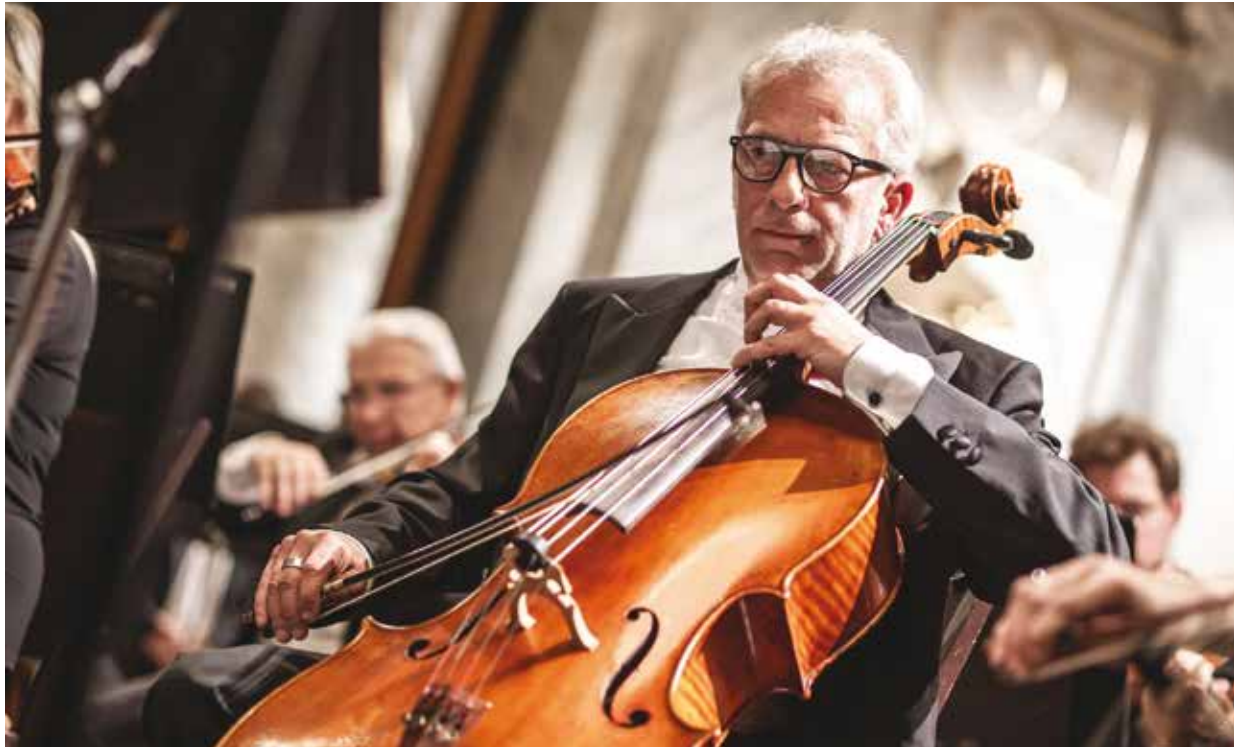
Koncert Plzeňské filharmonie ke stému výročí vzniku samostatné republiky v Městanské besedě v Plzni měl velký úspěch.