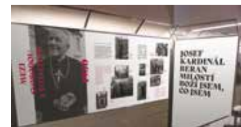
Vizualizace expozice s názvem Josef kardinál Beran: Milostí Boží jsem, co jsem.

Expozice s názvem Josef kardinál Beran: Milostí Boží jsem, co jsem bude k vidění v mázhauzu plzeňské radnice od 27. listopadu do 14. prosince 2018. Vernisáž doprovodí v Obřadní síni hudební komorní program Plzeňské filharmonie. Výstava si klade za cíl přiblížit osobnost tohoto muže, jeho službu vlasti a církvi, nadčasové myšlenky i nerovný souboj s totalitním zřízením, ať nacistickým či komunistickým. Připomene rovněž silné pouto k rodnému městu, rodině a vrátí se k repatriaci kardinálových ostatků, události, která nemá v naší zemi obdoby.