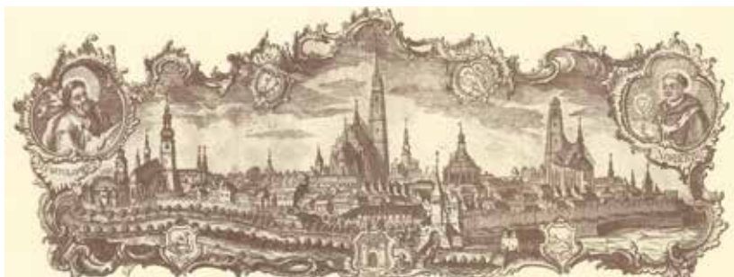
Veduta od Rehoře Balzera znázorňuje Plzeň od východu v druhé polovině 18. století.

Nové umění proniklo do města naplno až po roce 1700 a do konce první poloviny 18. století byla barokně přestavěna či znovu vystavěna většina domů ve městě.