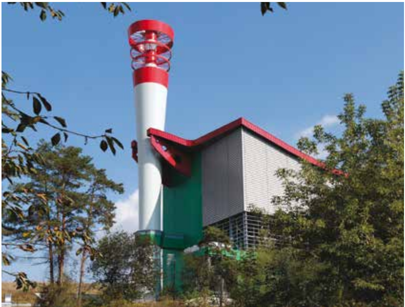
Spalovna v Chotíkově.

Žaloby nebyly směřovány vůči investoři, tedy Plzeňské teplárenské, ale proti