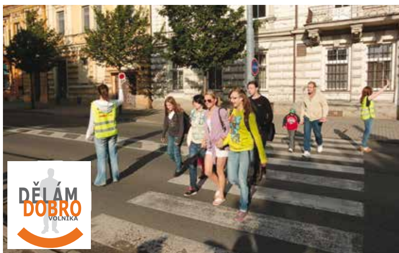
Dobrovolnice zajišťují lidem bezpečný přechod ulic.

Realizátorem projektu a současně tím, kdo dobrovolníky do služby vysílá, je organizace Společně k bezpečí, držitel akreditace ministerstva vnitra pro oblast dobrovolnické služby. Zaměřuje se