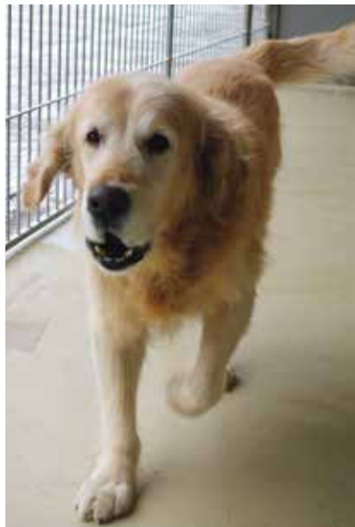
Psi mají k dispozici prostorné klece i velké venkovní výběhy. Na snímku vyléčený Bond.

Před Útulkem pro zvířata v nouzi v Daimlerově ulici na Borských polích, který provozuje Spolek pro ochranu zvířat v Plzni (dříve známý jako plzeňská Liga na ochranu zvířat ČR) a postavilo ho město, postává skupinka seniorů. Jsou to účastníci Plzeňské senior akademie, kterou pro ně připravuje Městská policie Plzeň ve spolupráci s magistrátem, městskými obvody Plzeň 1 až 4 a dalšími organizacemi. Brána se přesně ve 14 hodin otevírá pro seniory, kteří mají domluvenou exkurzi, ale