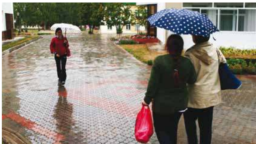
V závěru května lidi potrápilo deštivé počasí.

Dlouhodobý roční průměr srážek pro Plzeň činí 524 milimetrů, maximální roční úhrn 753 milimetrů byl naměřen v roce 1981, minimální úhrn v roce 2003 činil pouze 327,8 milimetrů. Loni byl třetí nejnižší úhrn za měřené období, jen 412,3 milimetrů. „Obecně platí, čím je více srážek, a tudíž oblačnosti v průměru v příslušném roce, tím je teplota nižší a naopak. Průměrné měsíční úhrny srážek mají rovněž maximum v letních měsících, výrazně nižší srážky bývají v zimní polovině roku. Nejdeštivějším měsícem v Plzni je v průměru červenec