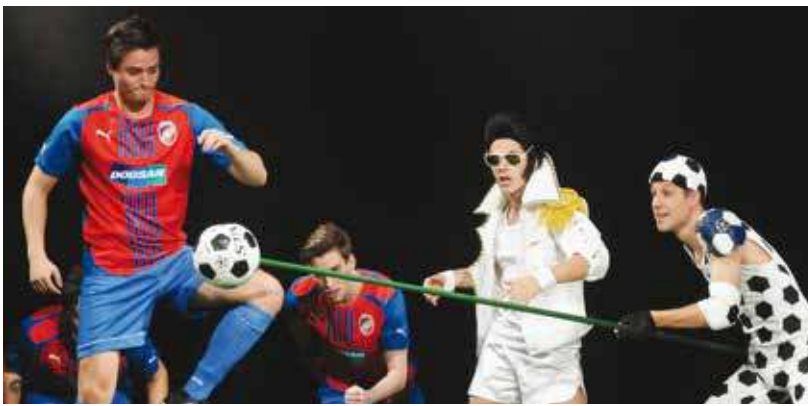
Na snímku scéna z muzikálu.