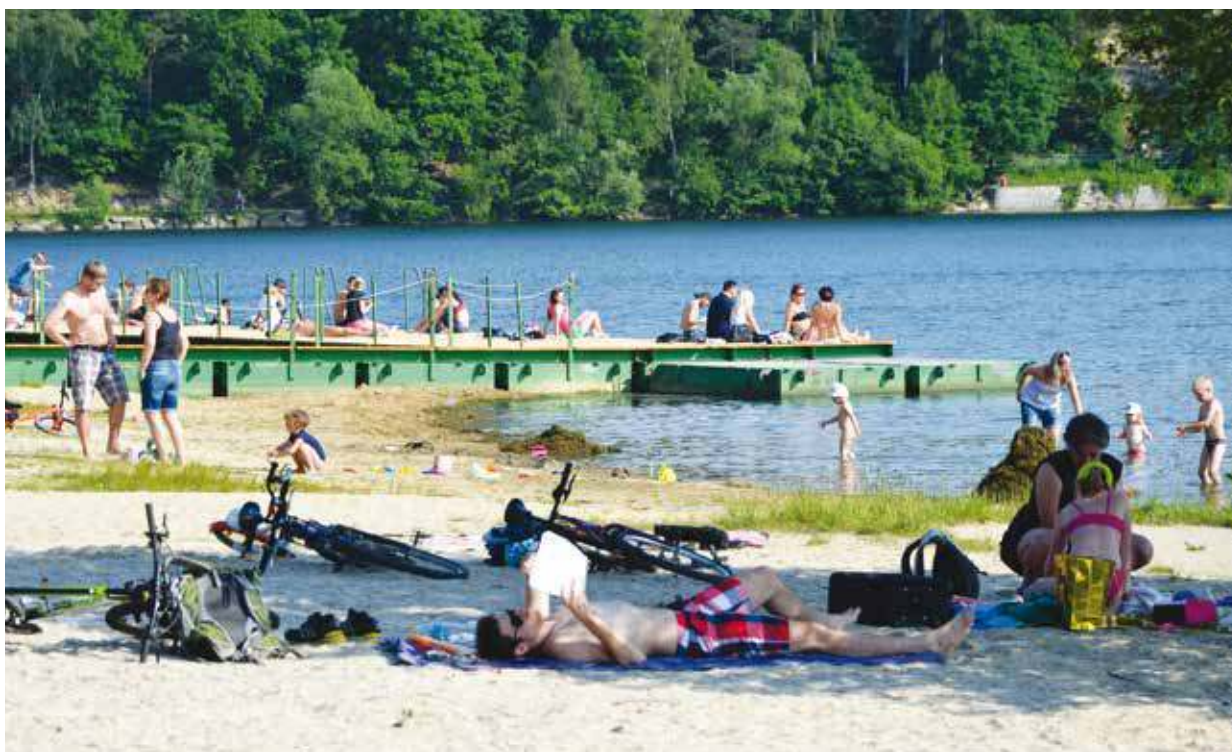
Pláže boleveckých rybníků jsou v horkých dnech místem, které vyhledávají milovníci opalování a koupání.

Rybníky Velký bolevecký, Seněcký, Kamenný a Šidlovský jsou přednostně ur-