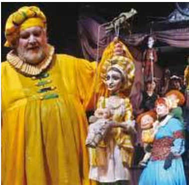
Na snímku ukázka z představení Lékařem proti své vůli.

Divadlo Alfa si pro svoji čtvrtou premiéru sezony 2015/2016 vybralo poněkud bláznivou komedii Lékařem proti své vůli, která je jednou z méně známých Moliérových her. Svě loutkové pojetí francouzské klasiky představí v dramaturgii Pavla Vašíčka a Petry Kosové osvědčená tvůrčí dvojice Alfí, umělecký šéf souboru, režisér Tomáš Dvořák a výtvarník Ivan Nesveda. Hlavní postavou příběhu je drvoštěp Sganarelle. Je nucen své „zázračné“ schopnosti prezentovat v domě