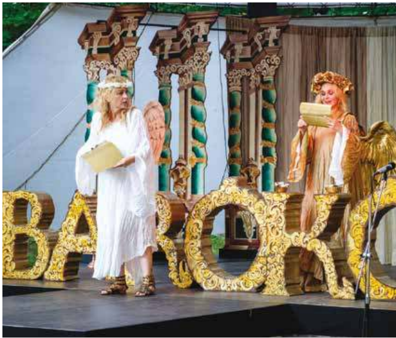
Snímek z loňského představení na Zelené hoře v Nepomuku.

Novinkou letošního festivalu je právě pravidelná autobusová doprava na všechny barokní slavnosti. Ta bude vyjíždět od