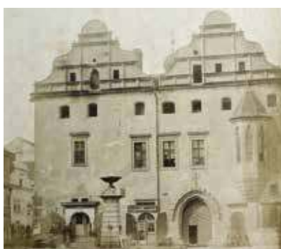
Říhovský dům

K nejvýznamnějším stavbám z tohoto období patří především stavby církevní. Staví se chrám sv. Bartoloměje, který je ještě v první polovině 16. století doplněn Štern-