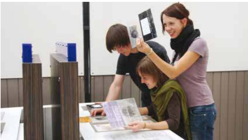
Mladí návštěvníci si zkoušejí praktiky kriminalistů.