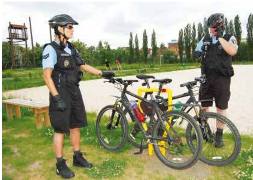
Kvalitní stojan představuje vhodně tvarované cykloopěradlo na dvě kola.

Pak bychom měli kolo zamknout. Zamyká se vždy rám kola, většinou společně se zadním kolem. Máte-li druhý zámek, i přední kolo. Smyčkou zámku byste měli obemknout rámovou trubku, zadní kolo a parkovací zařízení tak, aby smyčka zámku nešla vyvléknout. Chce-