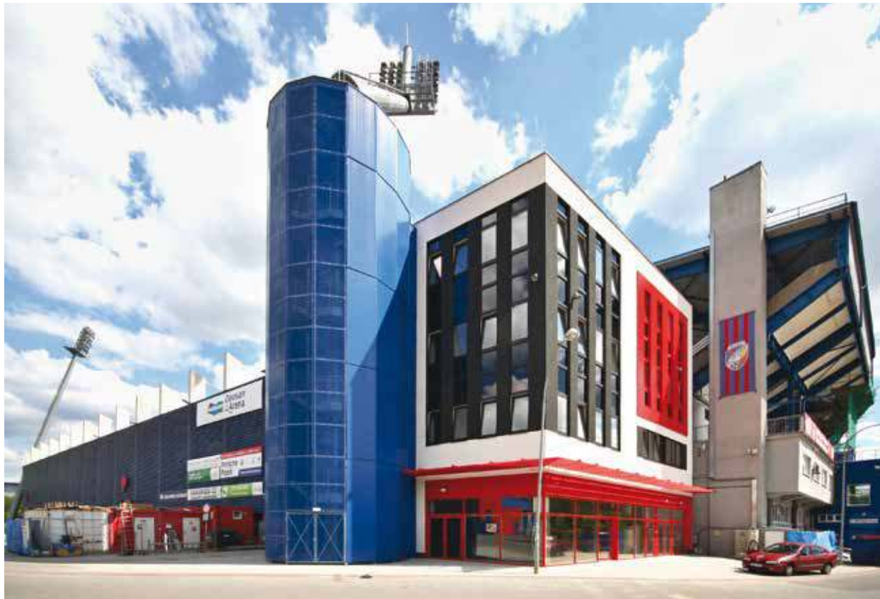
Severní věž v rohu Doosan Areny ve Štruncových sadech, kde hrají domácí zápasy fotbalisté FC Viktoria Plzeň, je hotová. Začíná stavba jižní věže, která by měla být postavena v závěru letošního roku. Práce financuje klub a zaplatí za to zhruba 90 milionů korun. Věže mají být ve viktoriánských barvách, tedy červené a modré. Po 40 letech přejdou do majetku města Plzně.