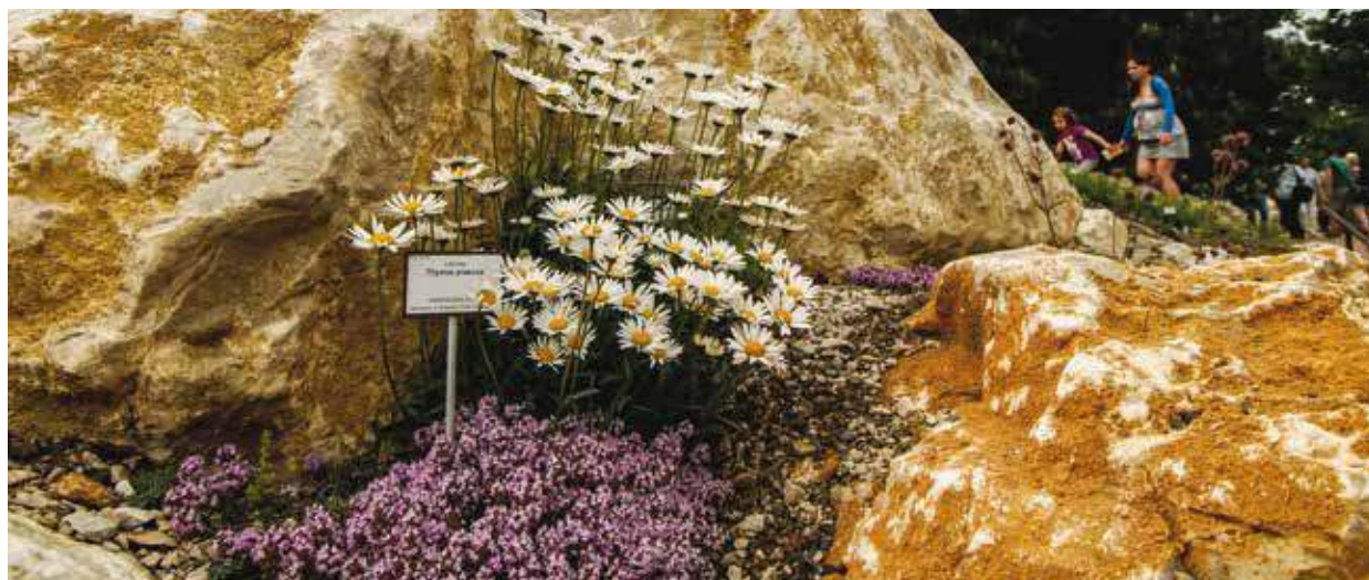
Mochna stříbrná, rozrazil alpský, hlediček, vrba nebo šťovík, to je jen drobný výčet horské flóry, která představuje nově otevřenou expozici Hory Evropy v plzeňské zoologické a botanické zahradě. Cesty se skalkami z různých druhů hornin umožňují procházku Evropou od západu k východu, ale také stoupání z montánního pásma přes subalpínské po alpské. Expozice ukazuje flóru celkem 16 evropských pohoří od Korsiky, přes Alpy, Apeniny, Pyreneje a Sierra Nevadu až po Karpaty.

Nové strážníky hledá Městská policie Plzeň. Nabízí zajímavé profesní uplatnění, odpovídající finanční ohodnocení a velkou řadu výhod, například možnost získání městského bytu nebo náborový příspěvek vyplácený ve výši tisíc korun měsíčně po dobu dvou let. Podmínkou přihlášení se k výběrovému řízení je 21 let, trestní bezúhonnost, spolehlivost, české státní občanství, středoškolské vzdělání zakončené maturitní zkouškou a tělesná, zdravotní a duševní způsobilost. Nováčci mohou nastoupit už v červenci. Podrobné informace k náboru jsou na webu www.mpplzen.cz/nabor . (red)