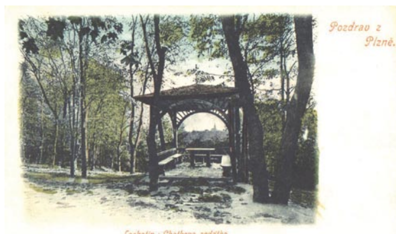
Lochotín : Chotkovo sedátko.

Lochotínský park má za sebou historii dlouhou téměř 180 let. Jeho vznik ve třicátých letech 19. století souvisel s plánem vybudovat v Plzni lázně s vel-