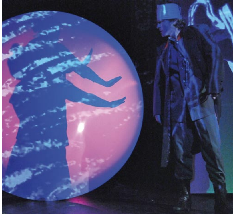
Novinkou letošní sezóny v Alfě je inscenace Křesadlo

I se zmiňovanými premiérami uvidí návštěvníci Alfy v této sezóně 20 inscenací, chybět nebudou ani proslavení Tři mušketýři, kteří naposledy sklízeli velké ovace na festivalu v Jeruzalémě, originální James Blond, oceněný letos v září na prestižním loutkářském festivalu PIF v Chorvatsku, Krvavé koleno, Kašpárek a indiáni nebo Démonův pramen. Na programu jsou i všechny loňské premiéry: Královský poker, Žabákova dobrodružství, Standa a dům hrůzy a Amberville, město plyšáků. (red)