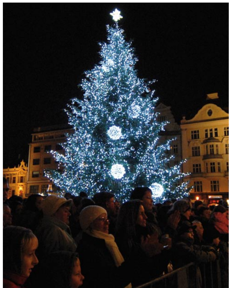
Vánoční strom na náměstí Republiky se poprvé rozzářil první adventní neděli 27. listopadu. Společně s primátorem Martinem Baxou a biskupem Františkem Radkovským jej rozsvítily děti z Městského ústavu sociálních služeb. Čtrnáctimetrová jedle pochází ze soukromé zahrady na Bílé Hoře. Letos je krásnější než v minulých letech díky novým moderním světelným a dekoracím prvkům za 817 tisíc korun z Plzeňské teplárenské. Zčásti obměněná je i světelná výzdoba v ulicích, nové prvky se objevily například na Chodském náměstí, v Kopecského sadech, na Wilsonově mostě, ve Zbrojnické a Prešovské ulici nebo pod Velkým divadlem. (red), foto: Martin Pecuch