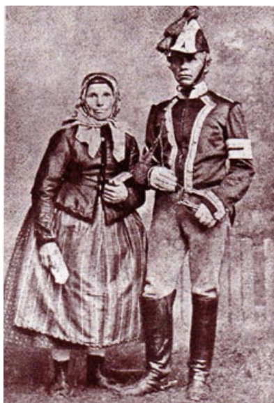
Plzeňský listonoš v dobovém úboru

Poštovní úřad sídlil kdysi v dnešní Riegrově ulici (dříve se jmenovala Poštovská) v domě č.p. 209. Na začátku 19. století se pošta stěhovala na Říšské předměstí do