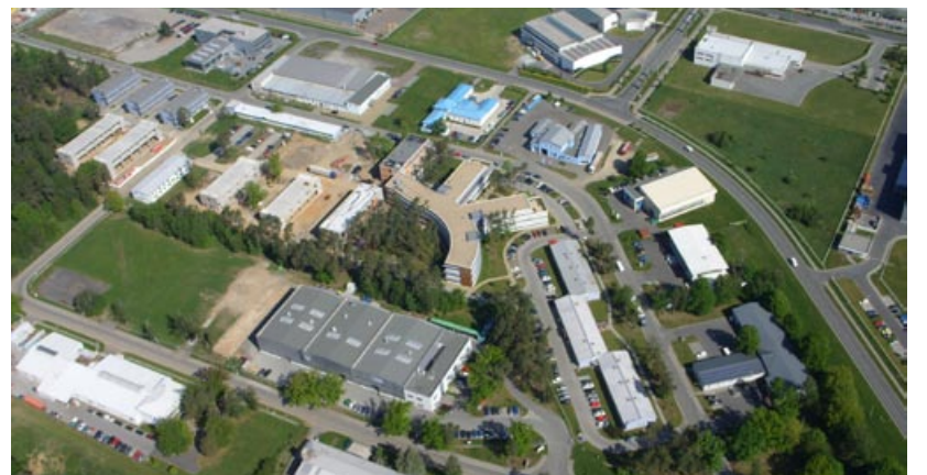
Plzeňský vědeckotechnický park

Výstavbu druhé etapy zahájila firma Metrostav na konci minulého roku. Podle původních předpokladů měly práce skončit v červnu 2012. Díky kvalitní koordinaci všech činností, logistice a dobré práci realizačního týmu začnou prostory sloužit o více než dva měsíce dříve. Celková cena projektu byla odhadována na 300 milionů korun bez DPH, dílčími úpravami se jí podařilo snížit na 236 milionů korun bez DPH. Prostředky budou hrazeny ze tří čtvrtin ze strukturálních fondů Evropské unie a dále z rozpočtu města a státu.