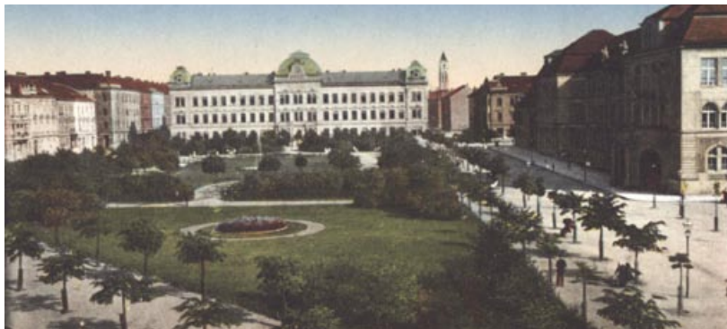
Mikulášské náměstí v původní podobě na kolorované fotografii