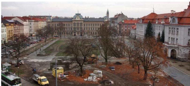
Mikulášské náměstí v prosinci 2011