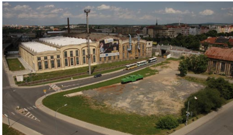
Techmania Science Center